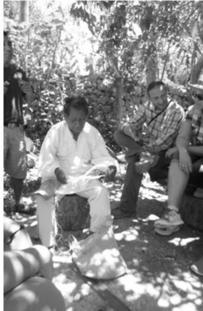
Figura 2 Hilado de henequén en la Cooperativa Xyaat. mayo 2015

entre la familia, del hilado henequén, de la medicina tradicional, la música, el bordado de hipiles y las clases del maya y sabidurías antiguas, yo creo que esto contribuye a que todos lo valoremos y lo cuidemos. (Entrev. Canté Canul, 2015)