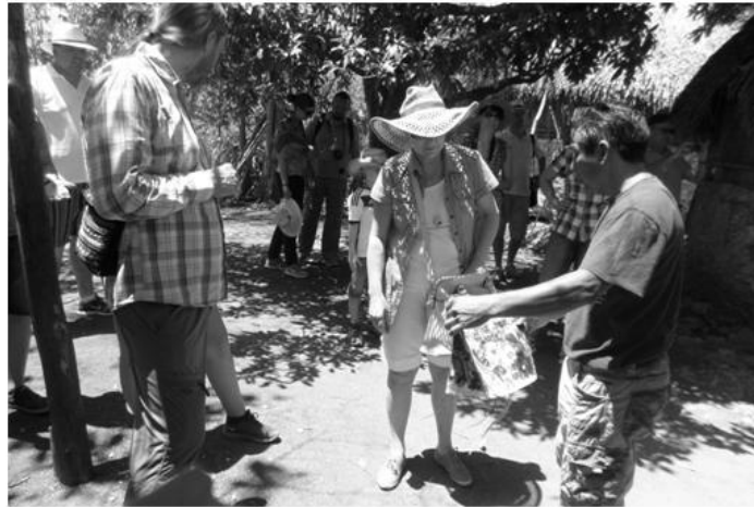
Figura 3 Líder de Xyaat enseñando en lengua maya la técnica del bordado.