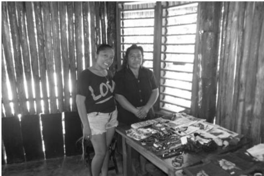
Figura 4 Mujer Maya vendiendo artesanías en la Cooperativa Xyaat . mayo 2015

[...] Creo que el proyecto ha creado bastantes trabajos, porque antes yo y mi sobrina no trabajábamos, pero ahorita con esto si tenemos chamba, pero no solo yo y mi sobrina encontramos trabajos, muchas de mis comadres trabajan aquí, además creo que cuando los visitantes vienen al pueblo a visitar Xyaat , muchas personas ganan su lanita vendiéndoles cosas, es bueno tener chamba porque antes yo y mi marido no teníamos algunos días para comer, pero ahorita con mi chamba, ya tenemos un poquito [de] más de cositas en la casa y un poquito más de dinero. (Entrev. Ek Pat, 2015).