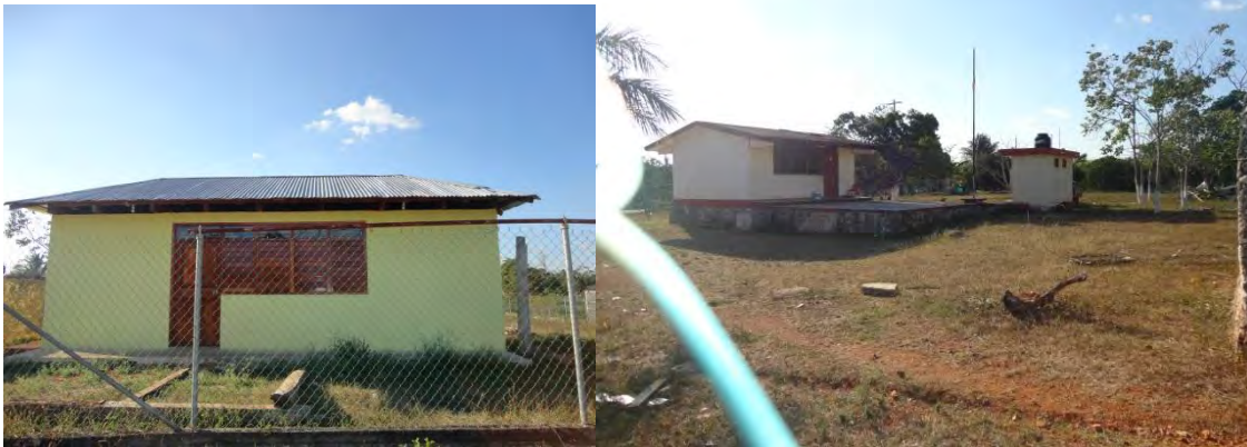
Salones de la Primaria Rafael E. Melgar