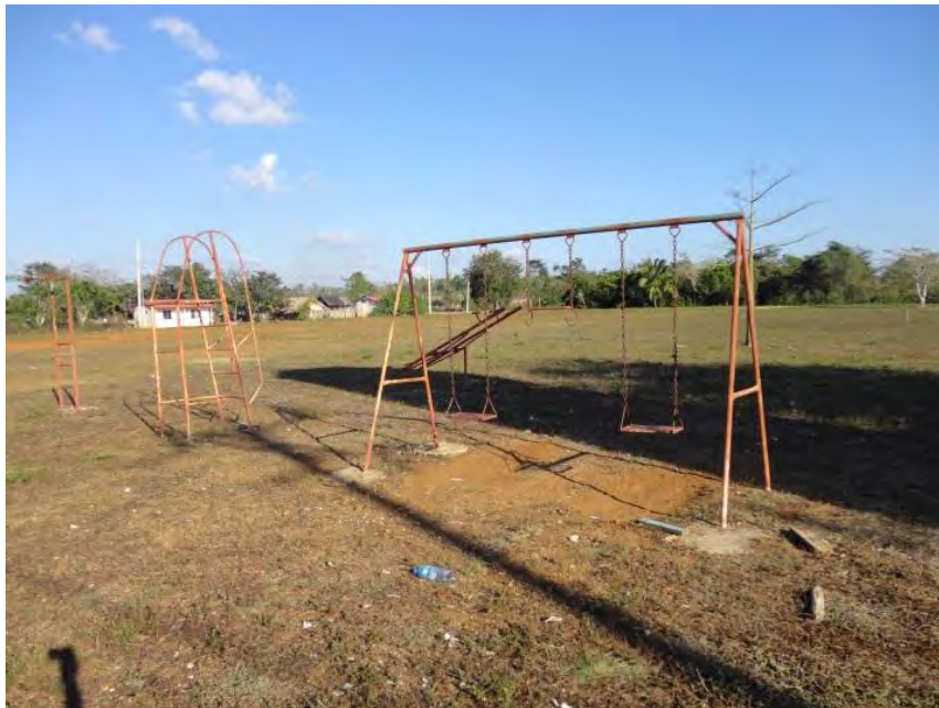
Parque de la comunidad de Payo Obispo

Respecto a espacios recreativos, hay un parque pero se encuentra en malas condiciones, ya que los juegos, como resbaladilla, subibaja, columpio y pasamanos se encuentran incompletos, rotos y oxidados, esta situación es peligrosa para los niños que juegan ahí. Además se tiene una cancha de fútbol, pero en realidad solo es un espacio de tierra roja y pasto donde los jóvenes han construido con palos las porterías para poder jugar. Esta cancha es aprovechada por los jóvenes en las tardes y los fines de semana.