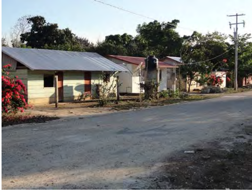
Tipos de vivienda de Payo Obispo