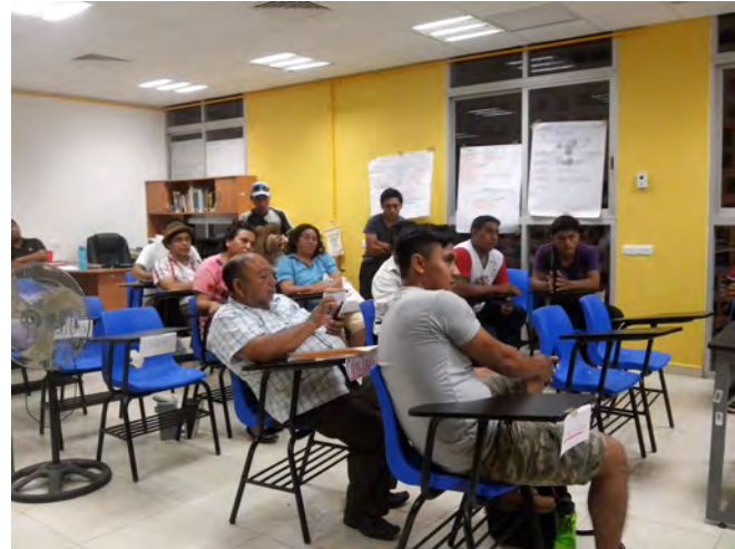
6. Capacitaciones para el manejo de apicultura, María Morelos Quintana Roo.