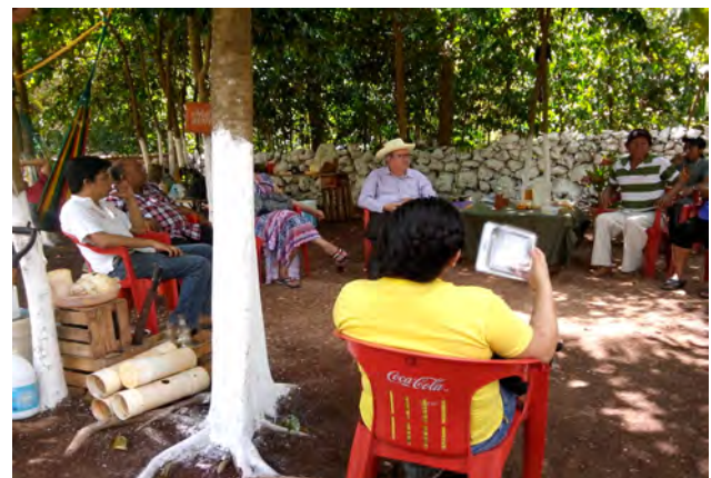
4. Reunión para toma de decisiones, Othón P. Blanco Quintana Roo.