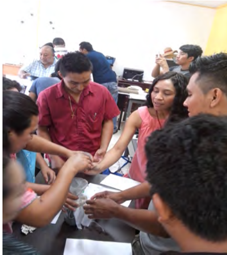
Foto 5. Diagnóstico de plagas José María Morelos José Quintana Roo.