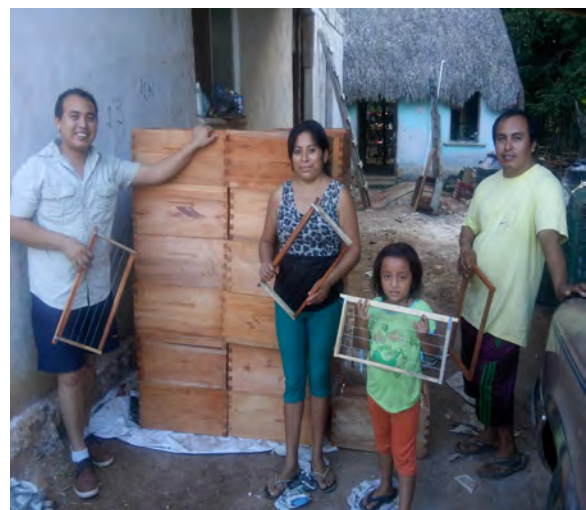
Foto 8. Materias recibidas a través del proyecto, Othón P. Blanco Quintana Roo.