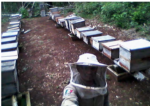
Foto 3. Revisión de colmenas foto, Othón P. Blanco Quintana Roo.