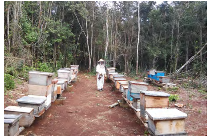
Foto 2. Trabajo colaborativo en el apiario Othón P. Blanco Quintana Roo.