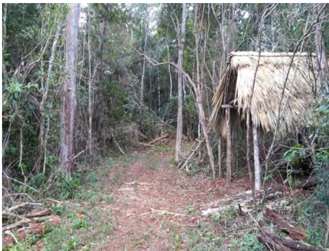
Foto 7. Avances del segundo apiario, Othón P. Blanco Quintana Roo.