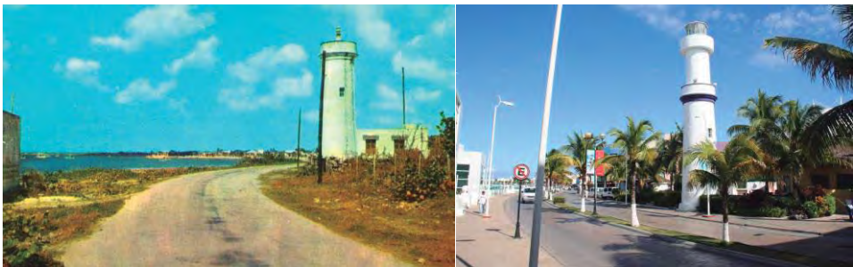
Figura 02. Punta Langosta – Plaza Punta Langosta.

La intensidad con la que se ha desarrollado el turismo en Cozumel ha provocado varios efectos, entre ellos, el aumento en los procesos migratorios, una intensificación del espacio para uso turístico – recreativo, principalmente con la construcción de plazas comerciales para la atención a los pasajeros de cruceros, dando lugar a la subsunción del paisaje y de la población para el desarrollo turístico del territorio (Ver Foto 02).