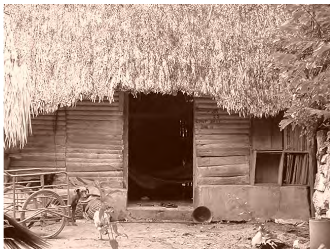
Foto 1. Choza en Pac-Chen, Quintana Roo.