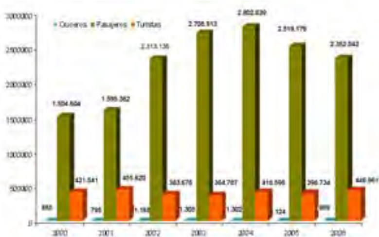
Gráfico N° 1 Cruceros, pasajeros y turistas en Cozumel 2000 – 2006

Elaborado con información de SEDETUR, 2007