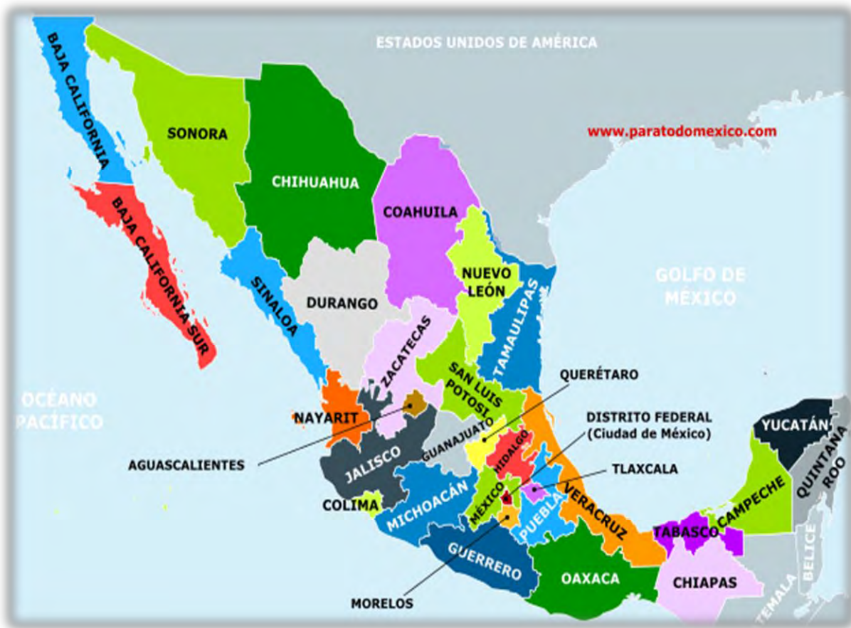
Figura 1. Presencia de la UCD, A.C. en México (2015).