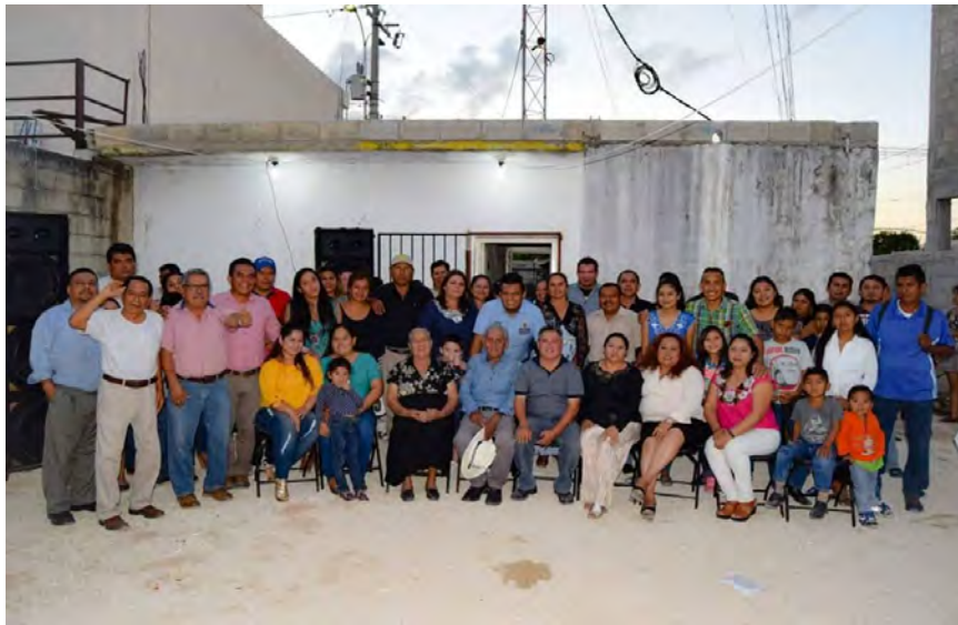
Imagen 1. Equipo de trabajo de la UCD del estado de Quintana Roo. municipio de Othón P. Blanco