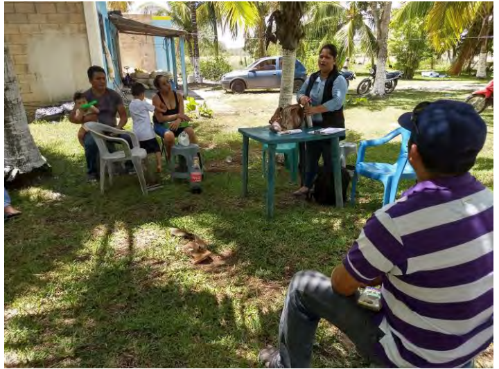
Imagen 7. Asesoría Técnica a productores de la loc., de Cocoyol. municipio de Othón P. Blanco.