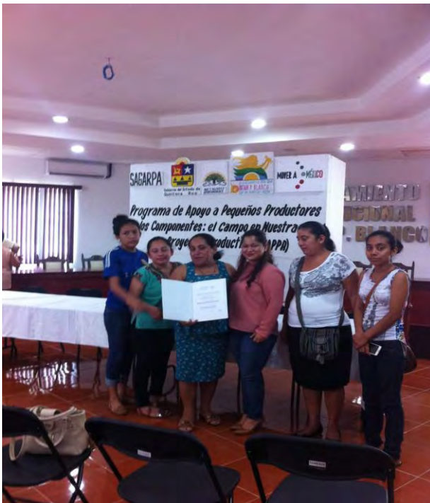
Imagen 2. Proyecto productivo de la comunidad de Cacao. municipio de Othón P. Blanco