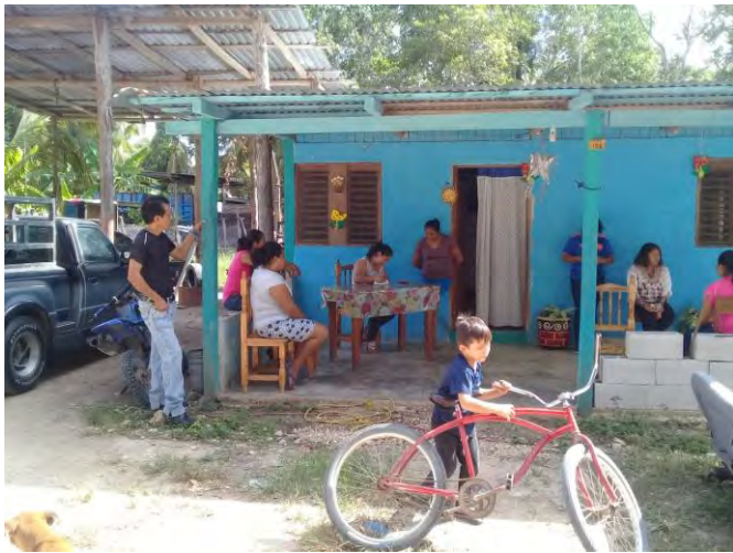
Imagen 6. Asesoría Técnica a productores de la loc., de Rovirosa. Fotografía de María Guadalupe Valerio Loya, municipio de Othón P. Blanco.