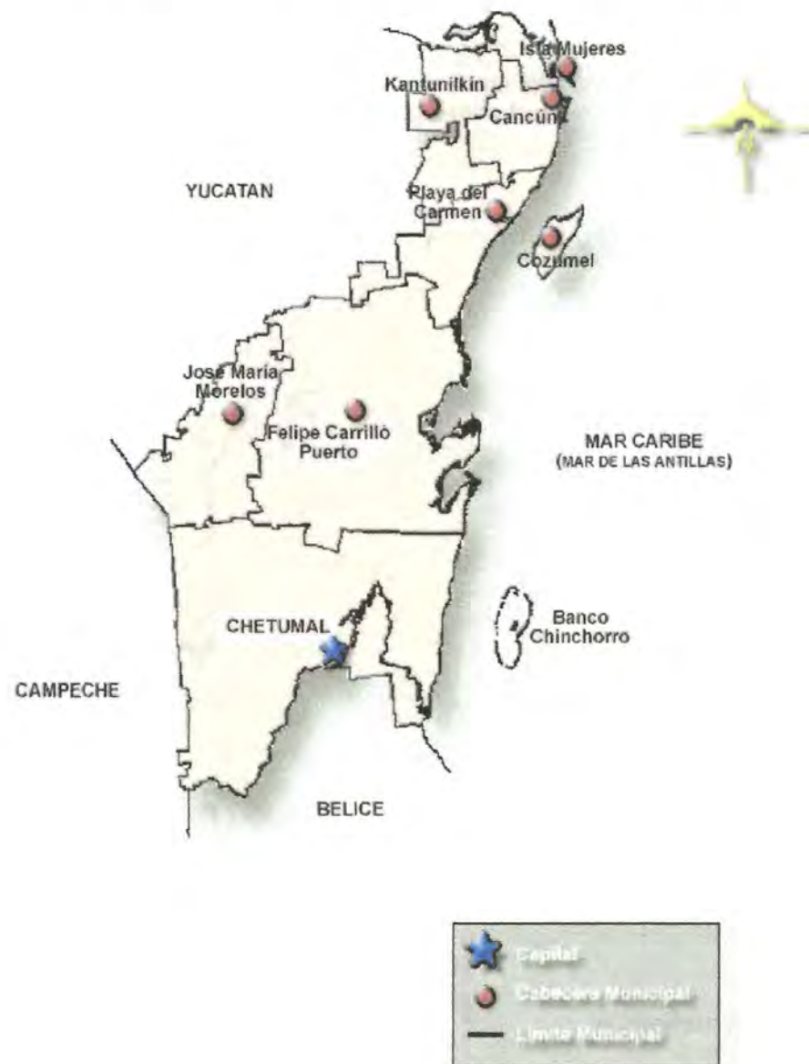
Mapa 1.- División Política Por Municipio Del Estado De Quintana Roo