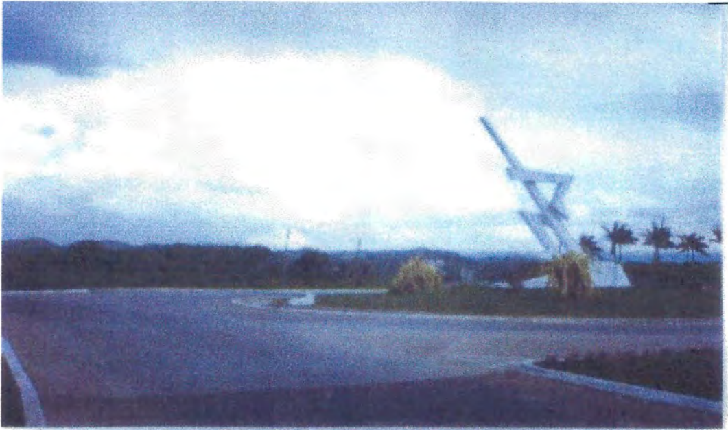
Monumento a la Libertad de Expresión de Belmopan, Belice, Centroamérica. 28/6/2006