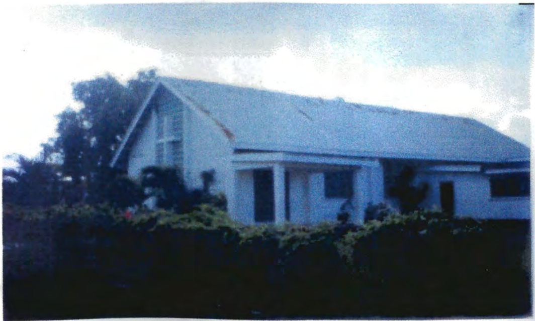
Iglesia Nazarena de Belmopan, Belice, Centroamérica. 24/6/2006