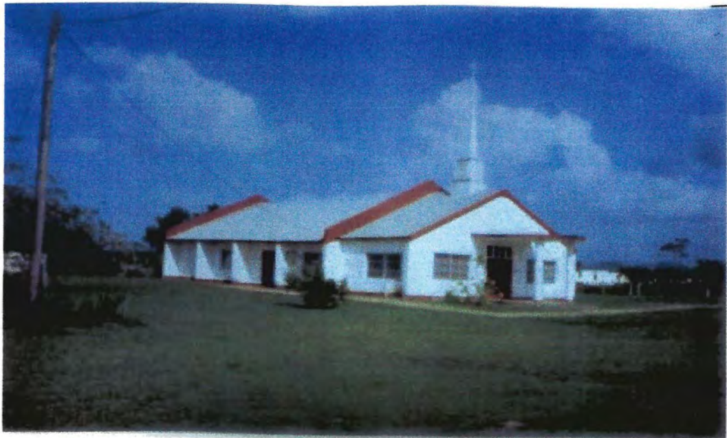
Iglesia Metodista de Belmopan, Belice, Centroamérica. 24/6/2006