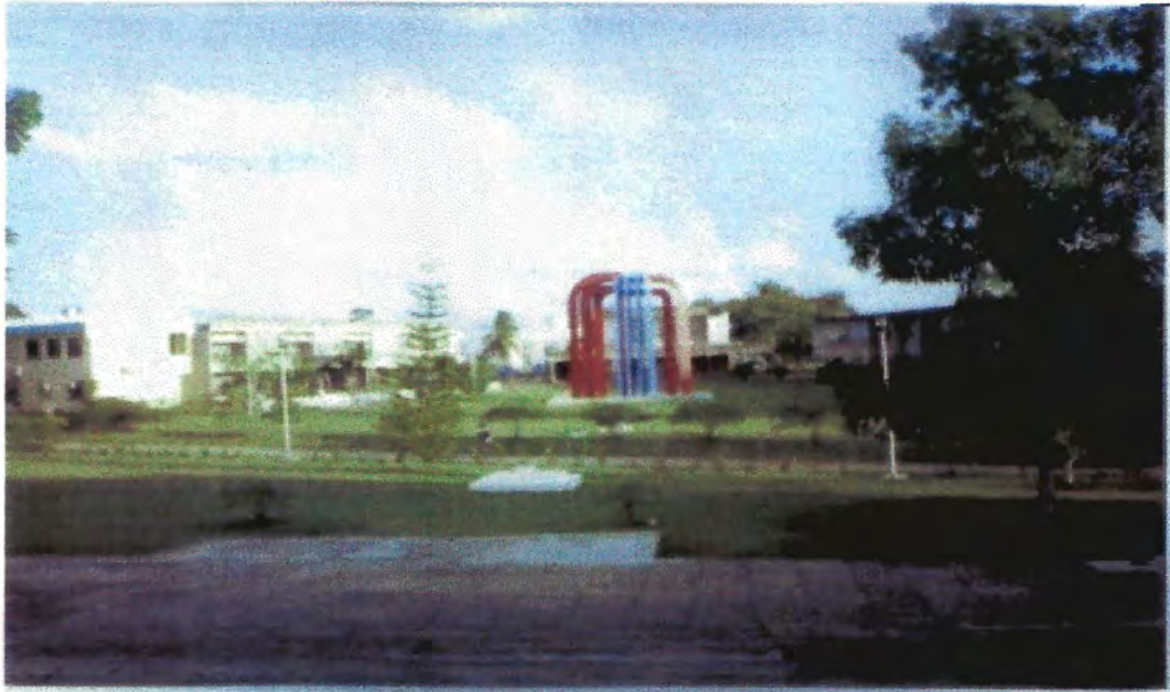
Plaza de la Independencia de Belmopan, Belice, Centroamérica. 18/6/2006