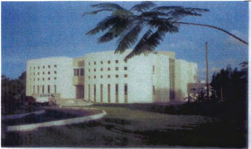
Banco de Desarrollo del Caribe. Belmopan, Belice, Centroamérica. 18/6/2006