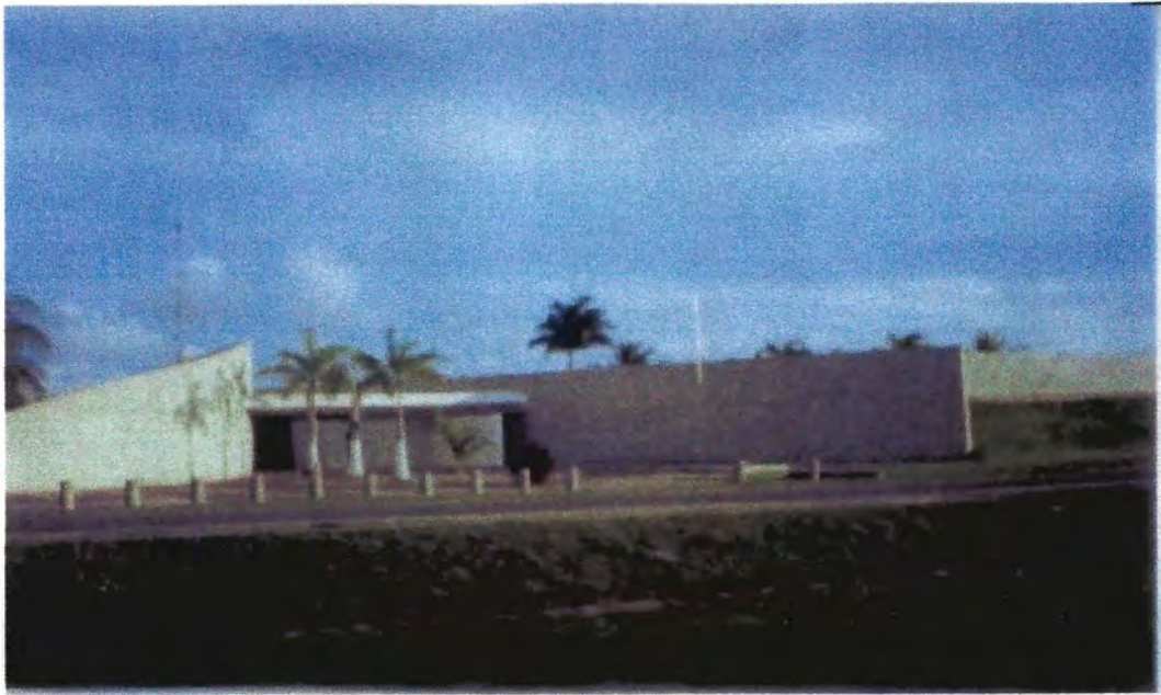
Embajada de México. Belmopan, Belice, Centroamérica. 18/6/2006