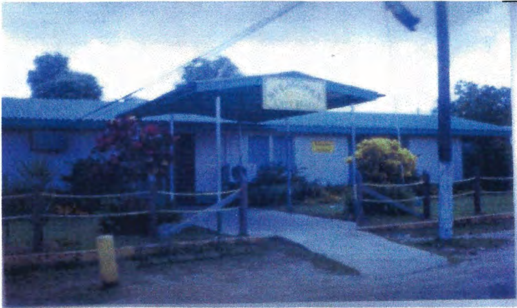
City Hall, de Belmopan, Belice, Centroamérica. 28/6/2006