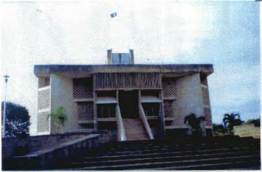
Congreso de Belmopan, Belice, Centroamérica. 18/6/2006