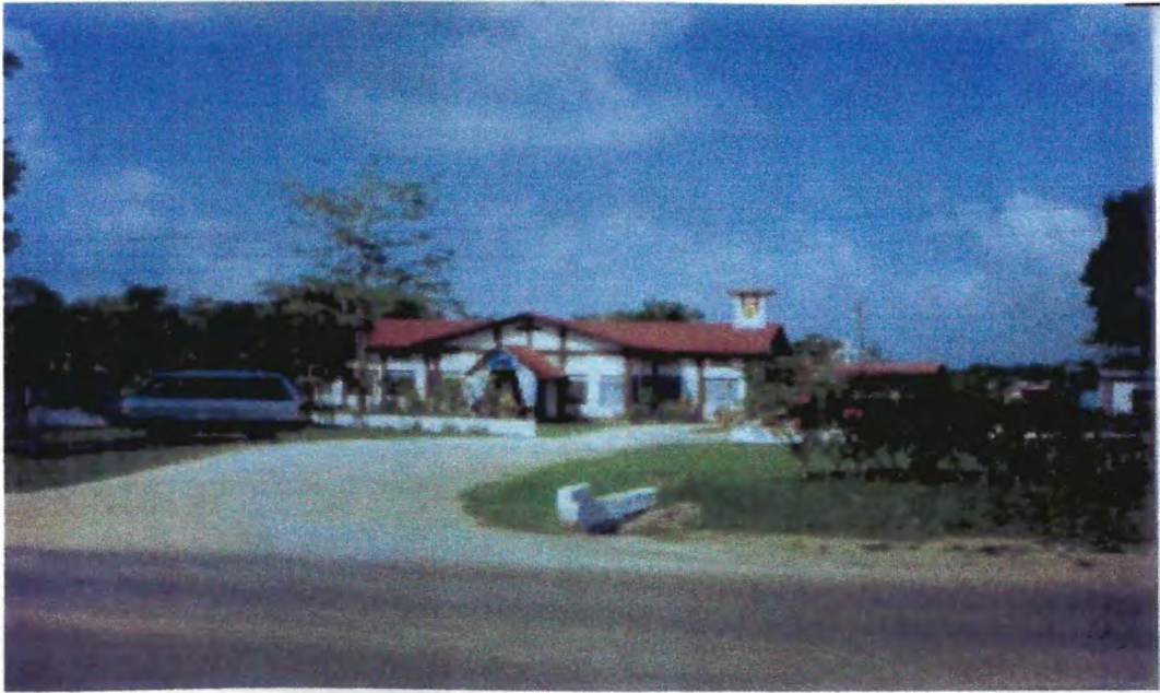
Iglesia Católica de Belmopan, Belice, Centroamérica. 24/6/2006