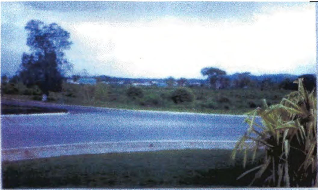
Colonia Las Flores de Belmopan, Belice, Centroamérica. 28/6/2006