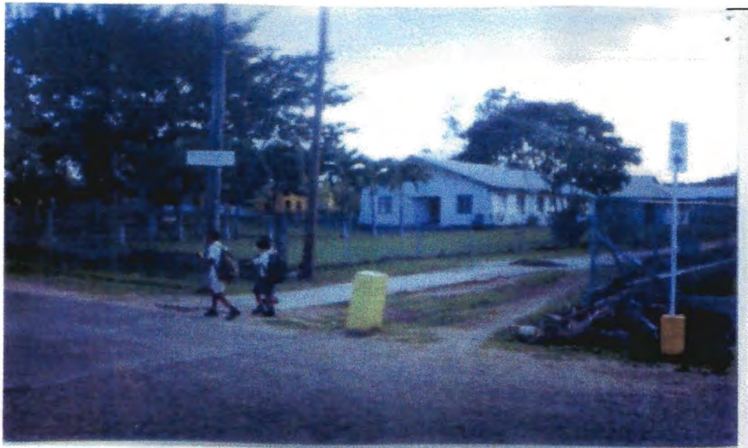
Iglesia Evangélica de Belmopan, Belice, Centroamérica. 24/6/2006