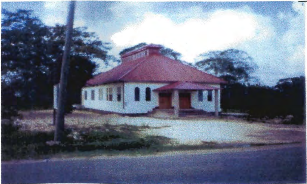
Iglesia de Cristo de Belmopan, Belice, Centroamérica. 24/6/2006