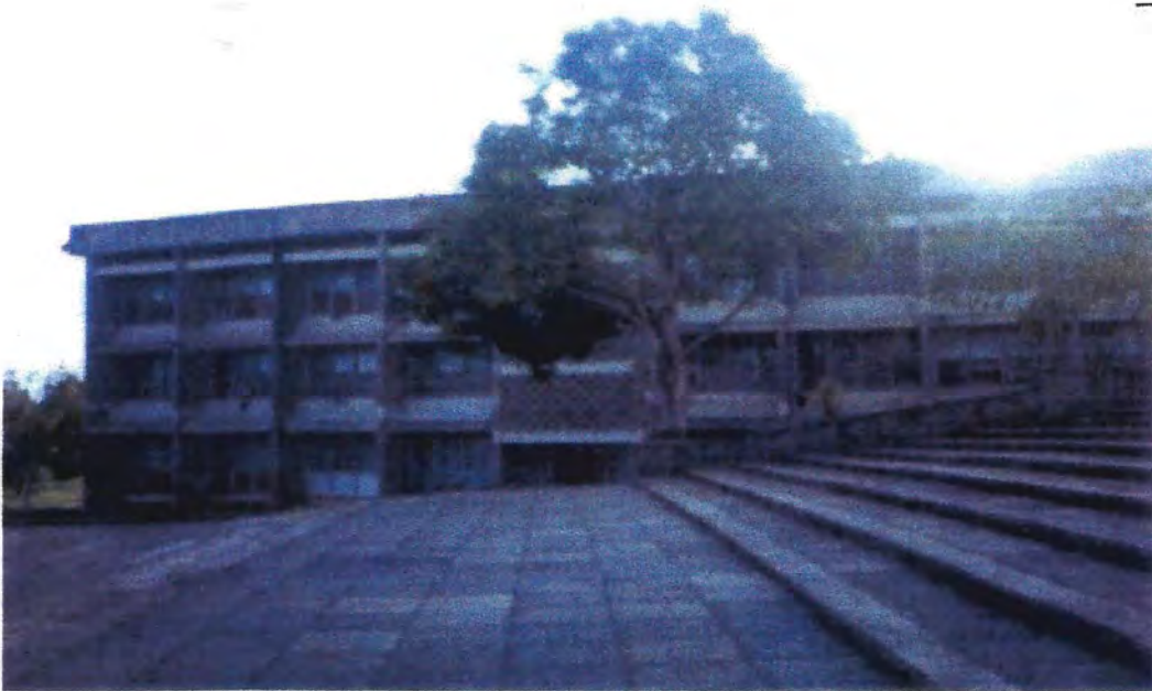
Ministerio de Recursos Naturales. Belmopan, Belice, Centroamérica. 18/6/2006