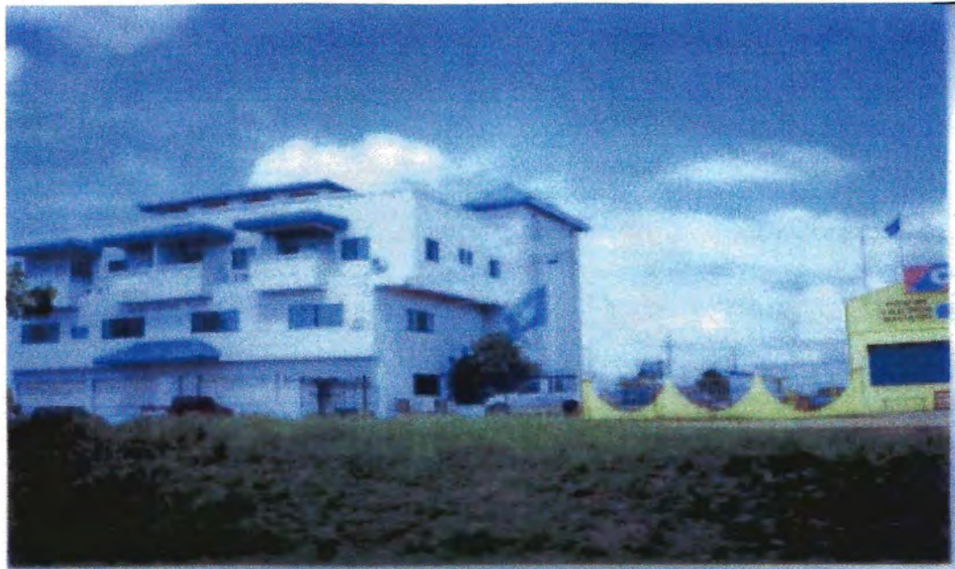
Casa de Las Naciones Unidas. Belmopan, Belice, Centroamérica 28/6/2006