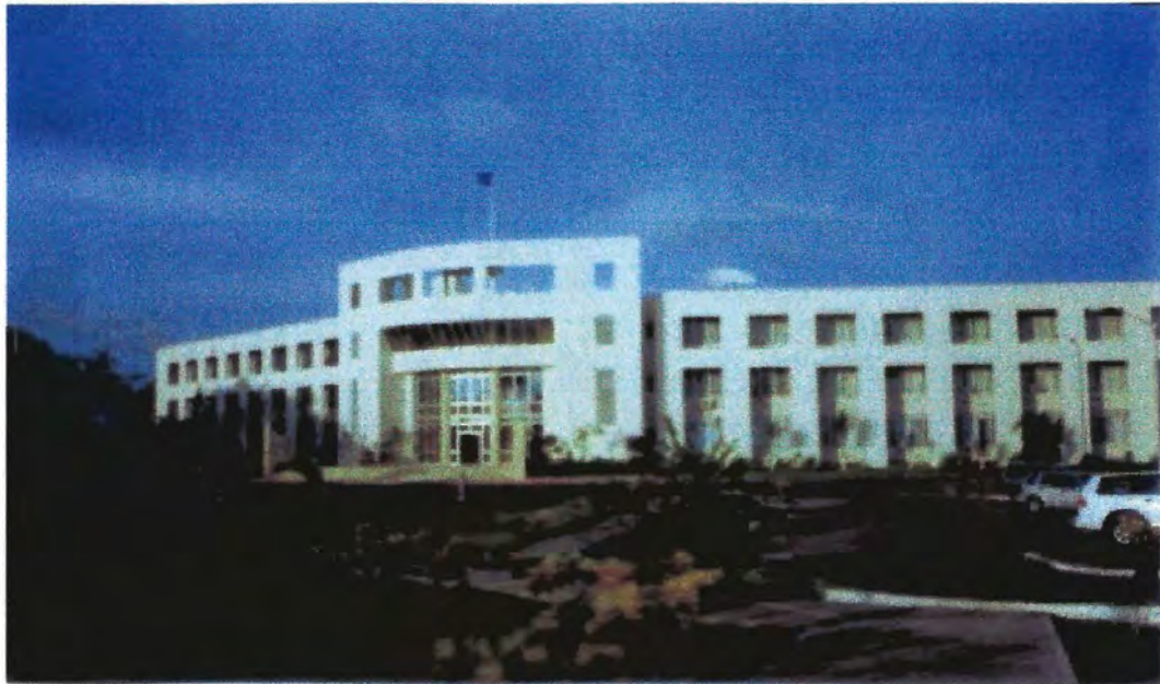
Ministerio de Desarrollo Económico y Estadística. Belmopan, Belice, Centroamérica. 18/6/2006