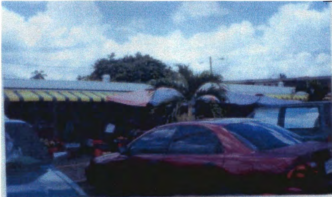
Mercado de Belmopan, Belice, Centroamérica. 28/6/2006