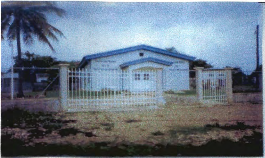
Salón del Reino de Los Testigos de Jehová de Belmopan, Belice, Centroamérica.