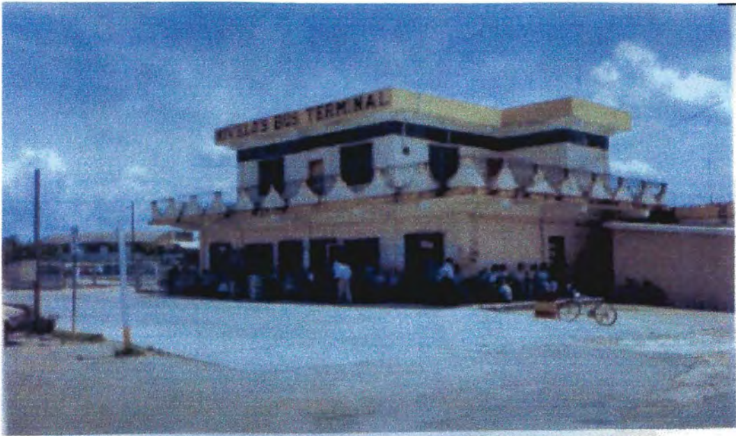
Terminal de Autobuses de Belmopan, Belice, Centroamérica. 28/6/2006