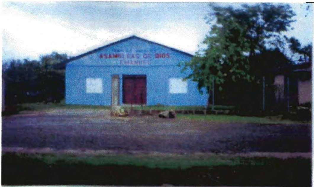
Iglesia Emmanuel de Belmopan, Belice, Centroamérica. 24/6/2006