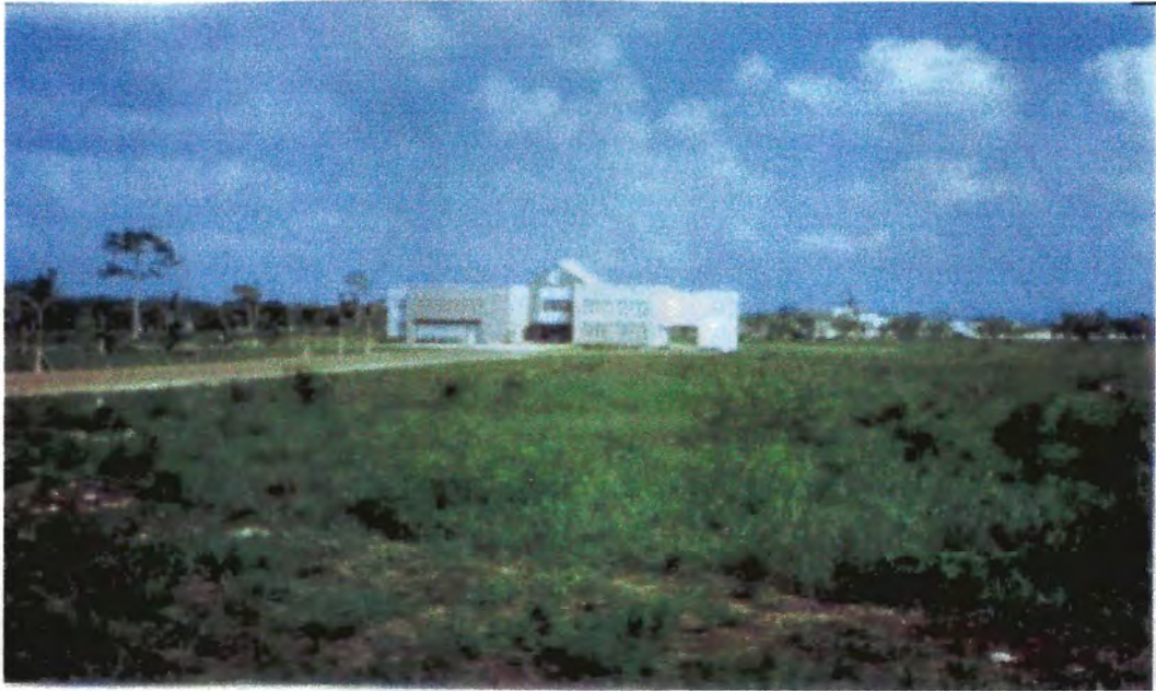
Centro George Price. Belmopan, Belice, Centroamérica. 25/6/2006