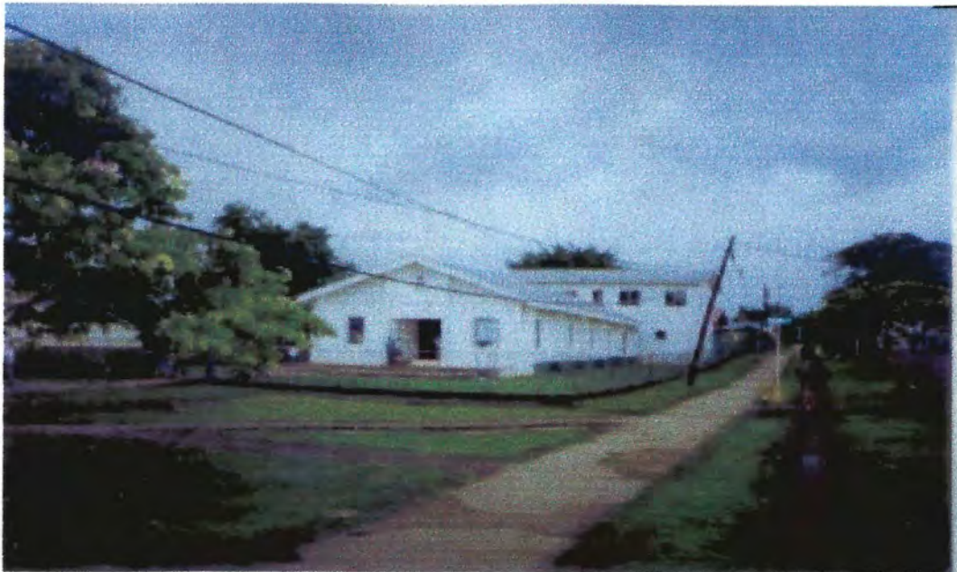
Iglesia Bautista de Belmopan, Belice, Centroamérica. 24/6/2006