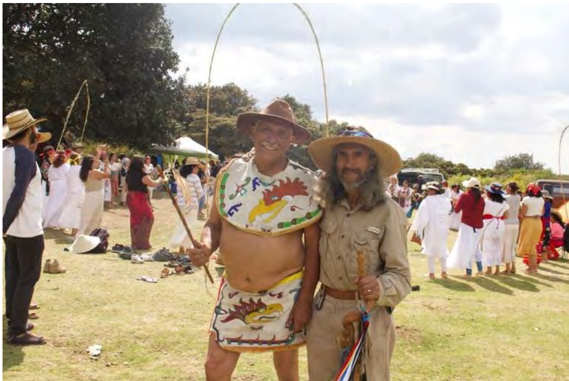
Figura 19. Guías espirituales, Las Margaritas