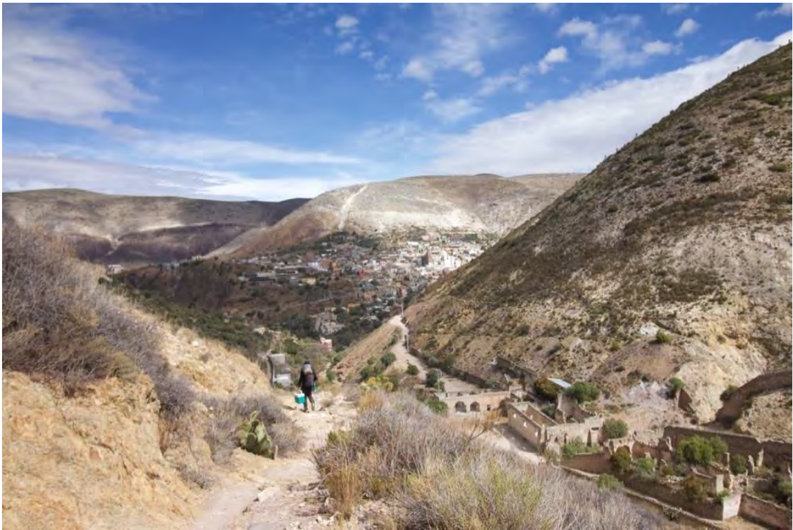
Figura 3. Vista panorámica donde se puede apreciar de la cabecera municipal de Real de Catorce desde el sendero que lleva al Cerro del Quemado kilómetro 2, y los atractivos vestigios arquitectónicos coloniales de la época de oro del pueblo, la importancia cultural de este sendero para la cultura Wixárika es mucho mayor a la de los locales.

El municipio de Catorce en el estado de San Luis Potosí es uno de los lugares más emblemáticos de México, situado en el estado de San Luis Potosí, cuenta con una gran riqueza histórica y cultural, así como la una belleza natural única en su tipo teniendo sierra y desierto (véase figura 3). Uno de los puntos más representativos de este municipio es la cabecera municipal de Real de Catorce, la cual ha tenido un desarrollo económico importante en los últimos treinta años gracias al turismo (véase en figura 3) cultural y espiritual que atrae.