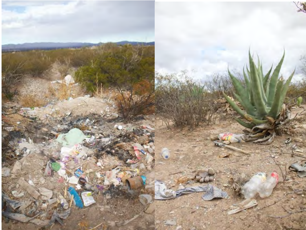
Figura 25. Basura en el desierto de Catorce a la orilla del camino principal, donde se puede apreciar basura procedente de locales y turistas teniendo la problemática que no hay sistema de camiones recolectores de basura para comunidades del desierto potosino, orillando a los locales a tirar basura fuera de sus propiedades.