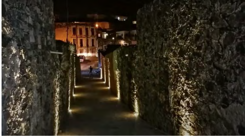
Figura 9. Callejón del centro de Real de Catorce, se instaló luminarias para realzar la arquitectura colonial del pueblo y para incentivar al turista a caminar de noche en el pueblo mágico de Real de Catorce, algo que ayudo a la comunidad local ya que no tenían luz en calles.