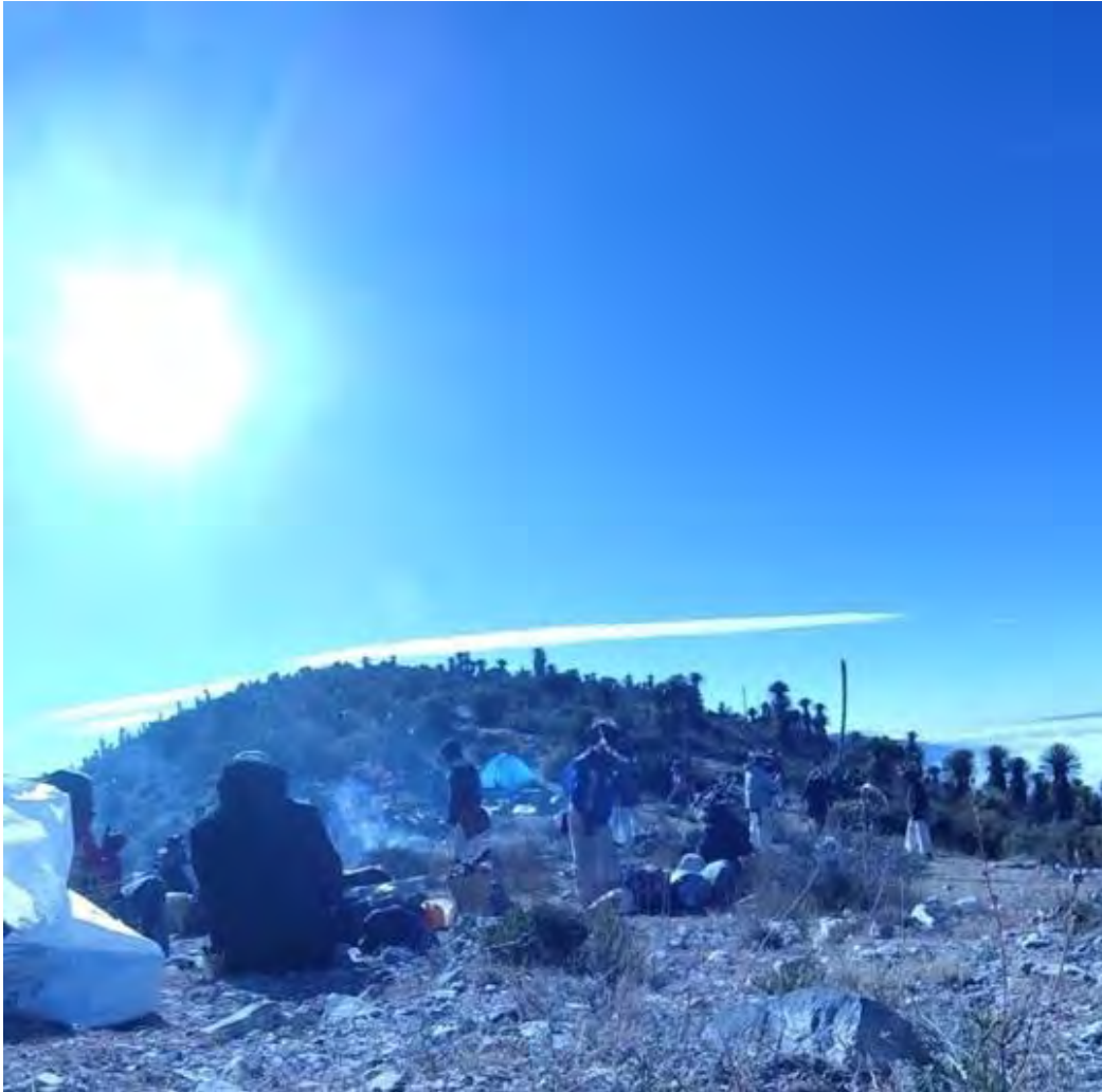
Figura 17. Ceremonia Wixarika en el centro ceremonial del cerro del quemado, después de la recolección del peyote se realiza una ofrenda de una res en el cerro del quemado rezándole toda la noche y al amanecer se sacrifica.

indígenas para asegurarse de que se respeten sus tradiciones y derechos culturales, y que evite cualquier tipo de explotación o apropiación cultural.