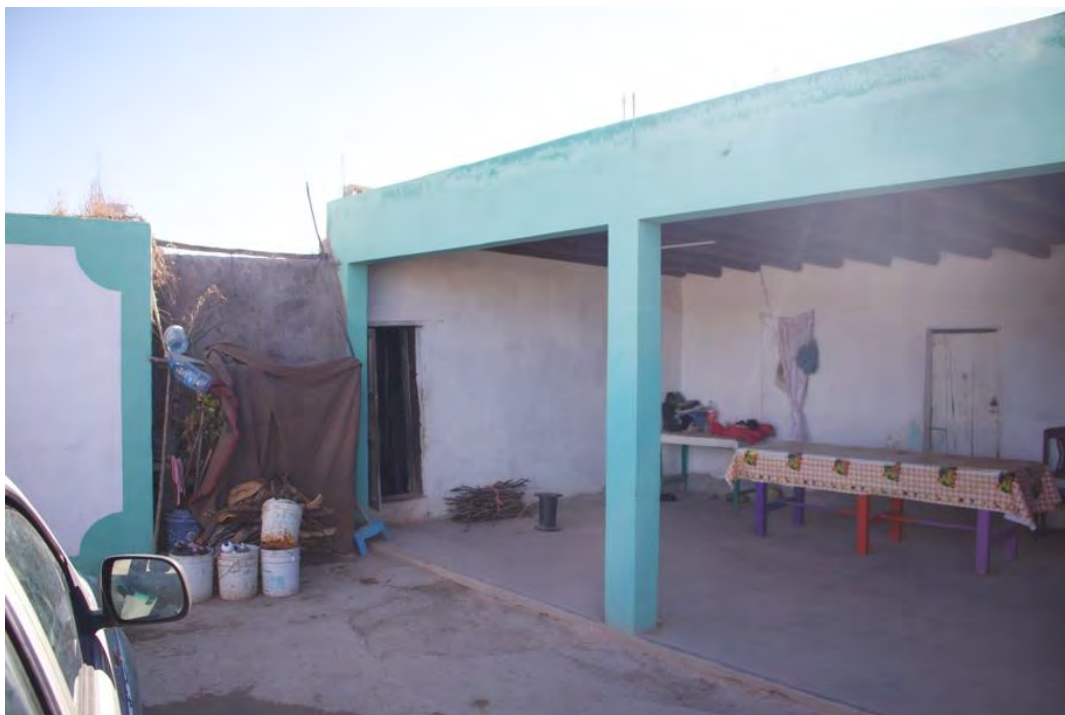
Figura 14. Recepción de “La Experiencia Wirikuta”, Las Margaritas, punto de información para cualquier visitante o peregrino que desconozca el modo operativo del espacio natural, gestionado por una familia quienes se encargan de proporcionar productos y servicios al visitante espiritual, ofertando estancia con servicios turísticos, el colectivo está formado por colombianos, españoles y mexicanos perteneciente a la comunidad de las margaritas.

senderismo en el desierto de Wirikuta, ajustándose a las necesidades y preferencias del viajero así como estancias en hoteles lujosos y restaurantes con una carta internacional teniendo licencias y permisos adecuados para operar en la zona. Las operadoras turísticas de turismo mágico espiritual ofrecen experiencias culturales o de aventura en el desierto potosino (véase en la figura 14) trabajando en colaboración con los chamanes y con las comunidades locales, o pueden ofrecer servicios independientes como temazcales o ceremonias con sincretismos.