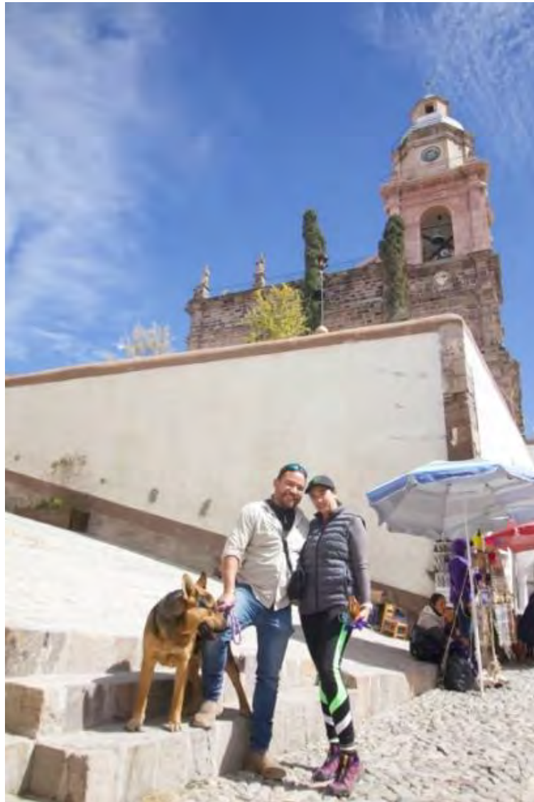
Figura 8. Turistas en el templo de la purísima concepción, punto turístico importante cultural religioso católico el cual alberga hasta 30 mil peregrinos anuales en temporada de la fiesta patronal en el mes de octubre, saturando los servicios turísticos y provocando cierre temporal del túnel de acceso para solo peatones en la cabecera municipal, Real de Catorce.

La influencia de la cabecera municipal de Real de Catorce ha creado nueva infraestructura para complementar la demanda en los servicios turísticos, la afluencia de visitantes de todo el mundo (figura 8) ha puesto a Real de Catorce y el desierto potosino como destino cultural de México.