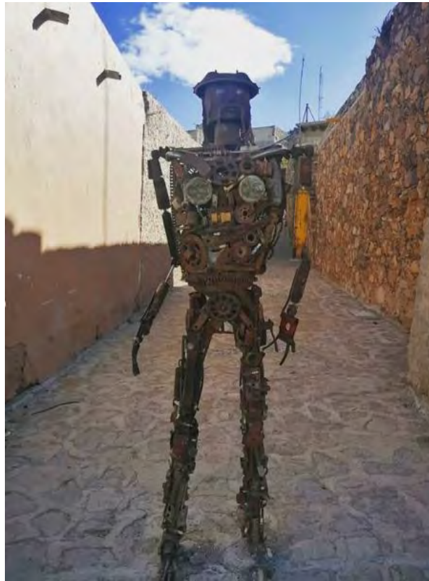
Figura 10. Callejón del centro de Real de Catorce, así se pueden percibir las calles del centro en las cabeceras municipal tras la restauración efectuada en la pandemia COVID-19 por pobladores del municipio, buscando ser más accesible para los miles de turistas que visitan el pueblo cada año.