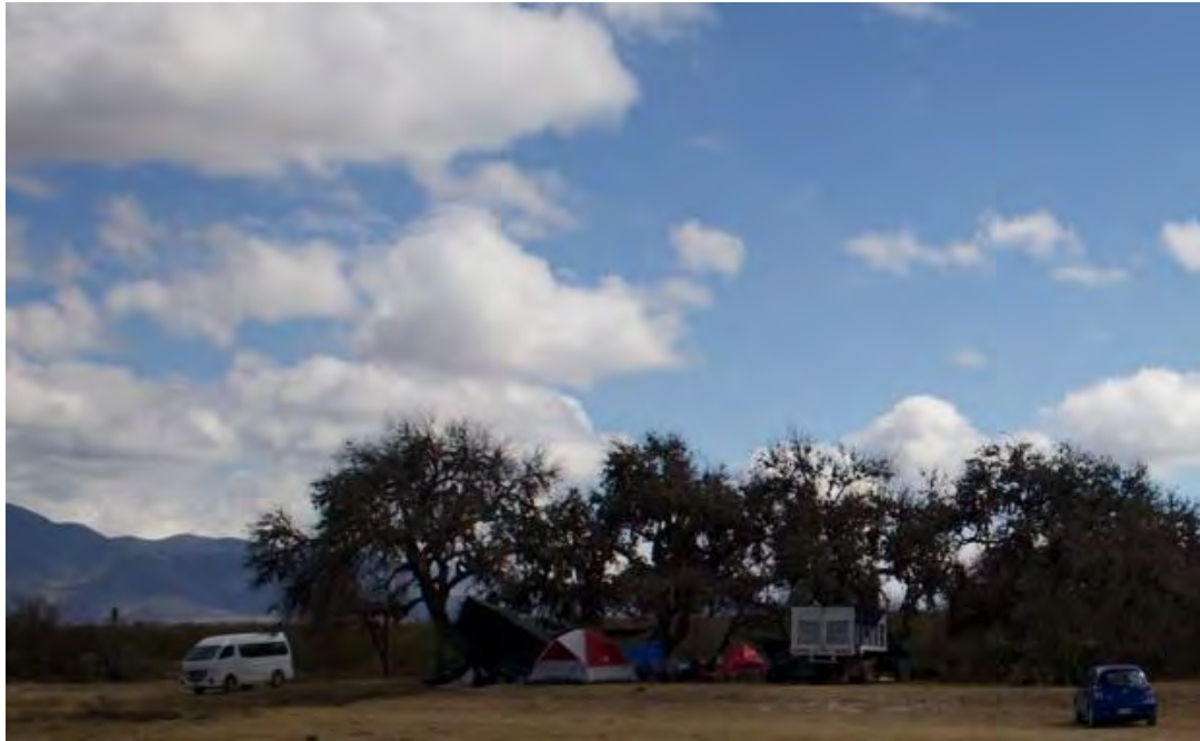
Figura 28. Campamento Huichol, Las margaritas, interacción entre turistas y peregrinos huicholes.

Los campamentos no autorizados presentan mucho riesgo para el ecosistema ya que encender fuego en áreas no permitidas, ocasiona un impacto negativo ocasionando incendios forestales.