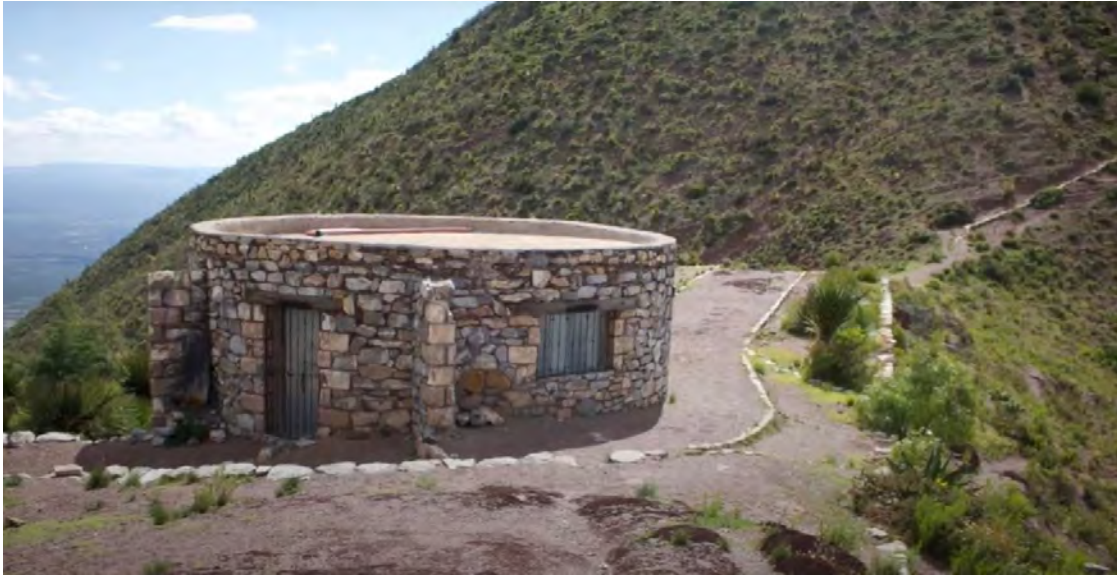
Figura 23. Caseta de Cobro ejidal previo a los últimos 200 metros al centro ceremonial Huichol, punto donde se deja los caballos para subir la última cresta 300 metros antes de llegar al centro ceremonial.