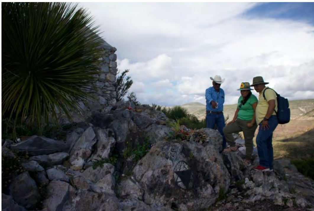
Figura 5. Turistas observando la piedra del niño quemado, mientras que su guía o caballerango interpreta la leyenda Wixárika del niño sacrificado en nombre del Sol en el Cerro del Quemado; representa una afluencia turística para la cabecera municipal de Real de Catorce y una derrama económica para la comunidad ejidal de Catorce.