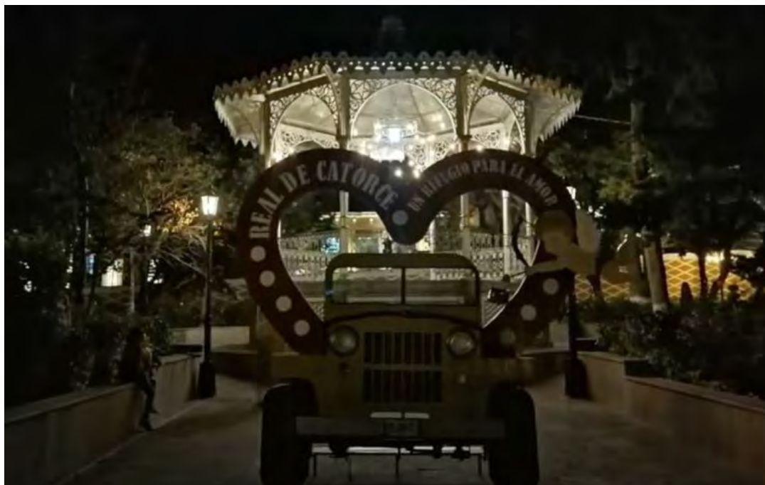
Figura 4. Plaza principal de Real de Catorce restaurada, donde se aprecia el carruaje de uno de sus atractivos turísticos, el vehículo todo terreno “Willi” teniendo antecedentes de utilizarlos en la segunda guerra mundial, hoy en día utilizados para realizar recorridos panorámicos turísticos en la sierra y en el desierto.