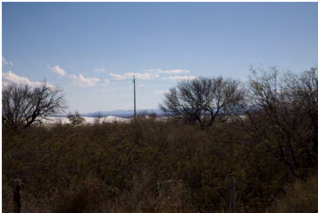
Figura 29. Al fondo se observan los invernaderos con la vegetación desértica los cuales han proporcionado complicaciones con la repartición del agua en ejidos del municipio de Catorce, los trabajos son mal pagados con el mínimo y el rechazo social es mucho, Estación, SLP.