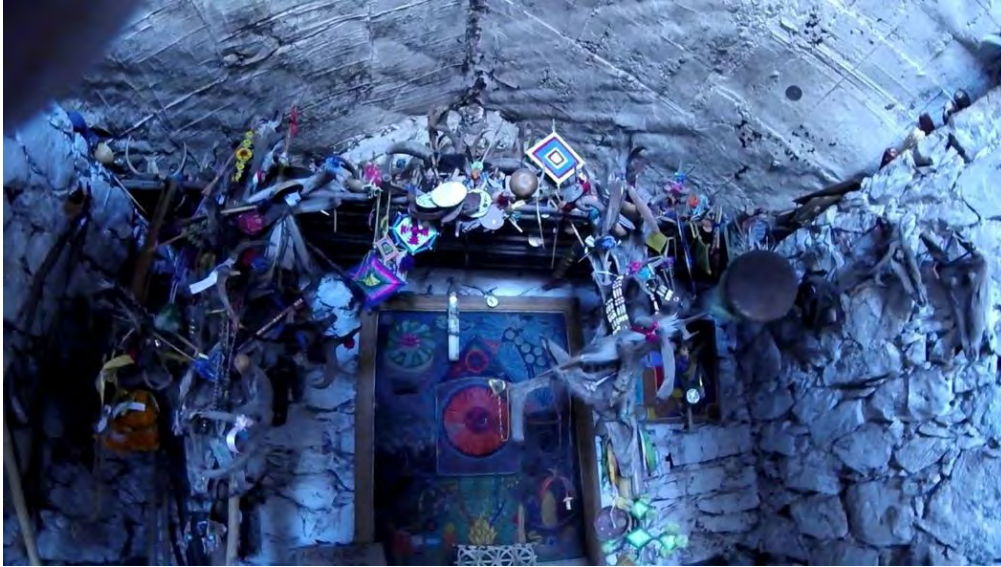
Figura 12. Altar mayor en el cerro del Quemado, es uno de los altares principales de la cosmovisión huichol al ser altar dirigido al dios peyote, dios Sol o dios venado podemos encontrar artesanías típicas huicholes a de más de cabezas de venado bisecadas al igual de velas y monedas ofrendadas por los visitantes.