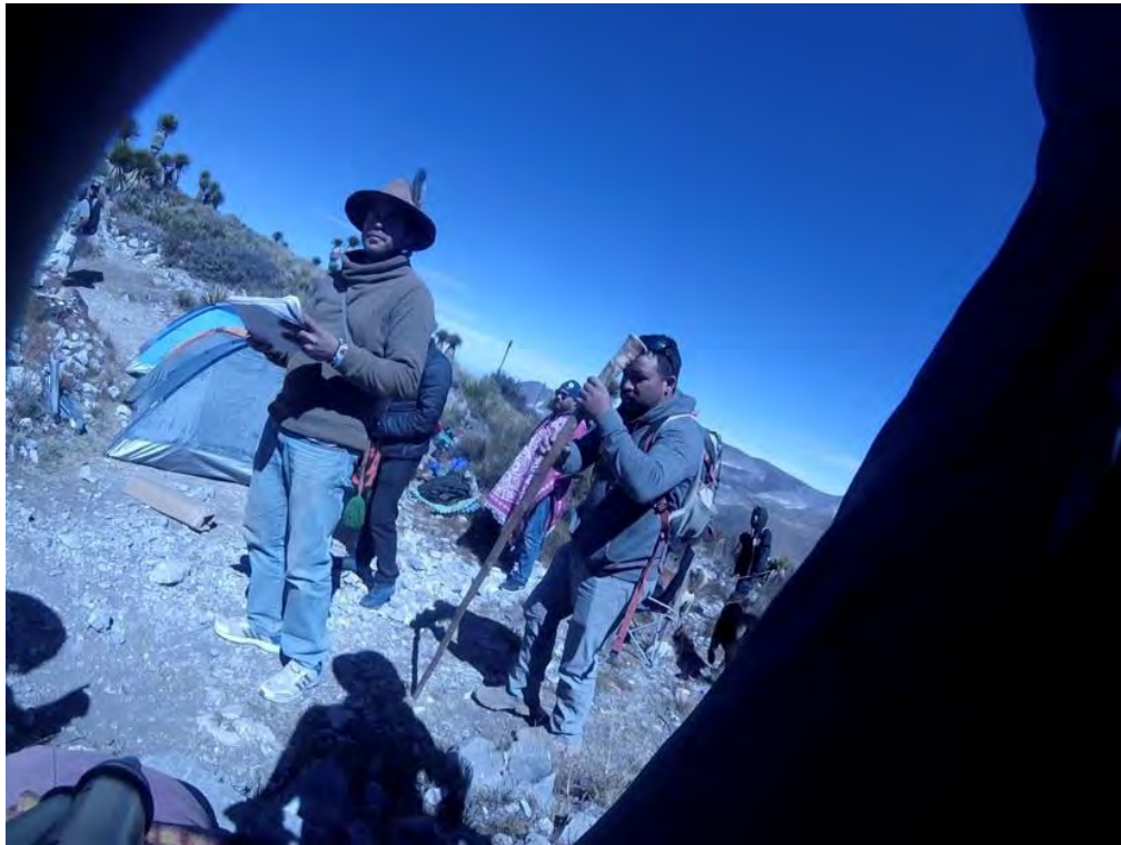
Figura 18. Turistas en ceremonia huichol, cerro del Quemado, esperando finalizar la ceremonia del sacrificio de la res.

Turista mágico espiritual: Los turistas o peregrinos espirituales en el turismo son grupos o individuos que recolectan peyote con el objetivo o fin de buscar experiencias espirituales (véase figura 18) y de autoconocimiento a través de una planta que contiene sustancias psicoactivas.