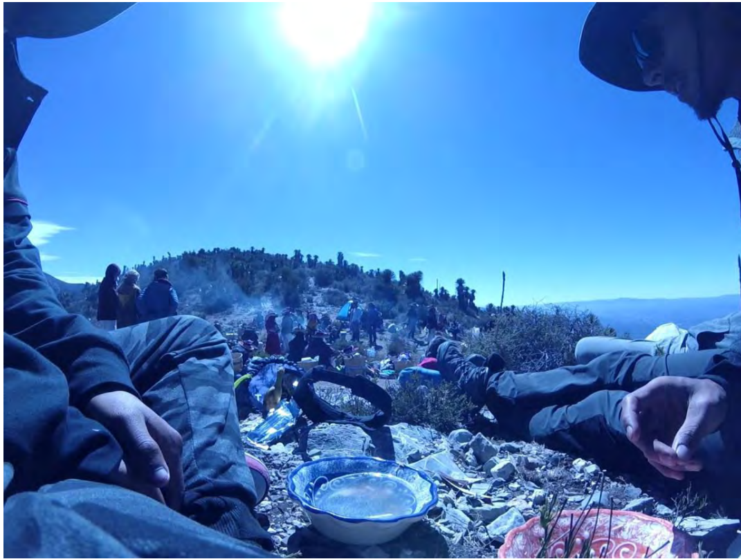
Figura 24. Turistas y huicholes compartiendo comida después de una velada ritual ceremonial con la ingesta de peyotes, rezos y cantos en el centro ceremonial de la cima del cerro del quemado. Se realizó el sacrificio de una res, la cual involucraba un significado de respeto y fertilidad, posteriormente se cocina un caldo de tierra el cual lleva la carne de la res sacrificada sin ninguna especie ni sal al ingerir su carne lo antes posible para obtener los veneficios del sacrificio, los curanderos huicholes ofrecen el servicio de limpias espirituales o energéticas las cuales tienen un costo de 250 pesos por realizarte la ceremonia personal en su círculo de protección y dura aproximadamente 3 minutos.

del rito ceremonial siendo turistas espirituales y trotamundos comprometidos con el medio ambiente, legados históricos culturales, tradiciones populares, con el objetivo de sentarse con una comunidad y tener alguna experiencia vivencial o exótica.