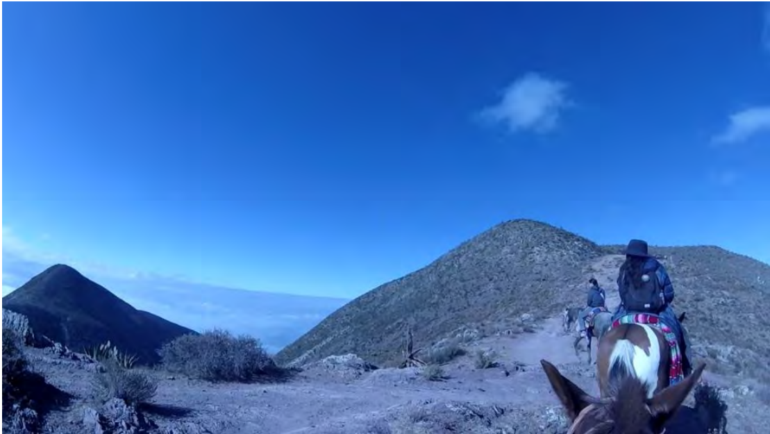
Figura 6. Recorrido a caballo guiado por el grupo de caballerangos al cerro del quemado con duración de aproximadamente 4 horas, desde la cabecera municipal; incluye interpretación de leyendas, caballo adiestrado para caminar en el sendero. Un costo extra es la cuota de la caseta ejidal que está en el acceso al centro ceremonial huichol los fines de semana o días feriados.

experiencias más salvajes y espirituales, pero con garantía de regresar al pueblo que contiene servicios e infraestructura para el turista, a raíz de eso la comunidad del municipio se organizó para dedicarse al comercio o servicios turísticos “siendo en casi su totalidad la actividad turística la principal fuente de ingresos (entrevista con el director de turismo escolaridad licenciatura, 2022).