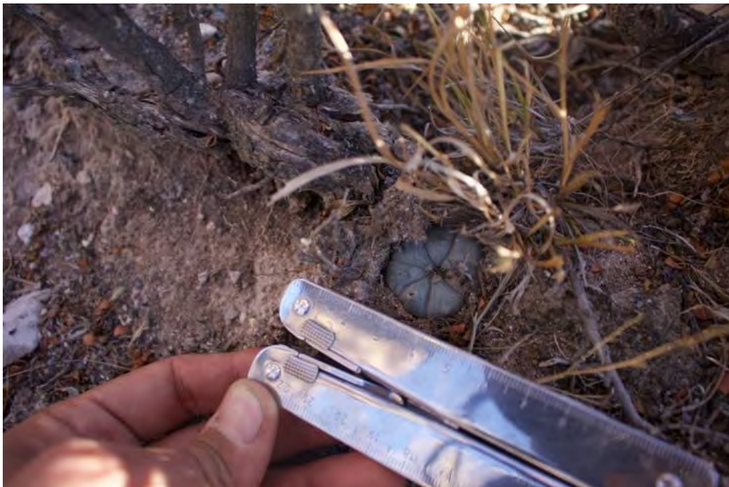
Figura 26. Peyote adulto de 4 cm de ancho

“el dueño de la casa nos platicó como se tenía que cortar, con navaja un corte limpio debajo de la cabeza y dejando la mitad en la tierra” (Kenia mujer de 31 años viajera española, 2022).