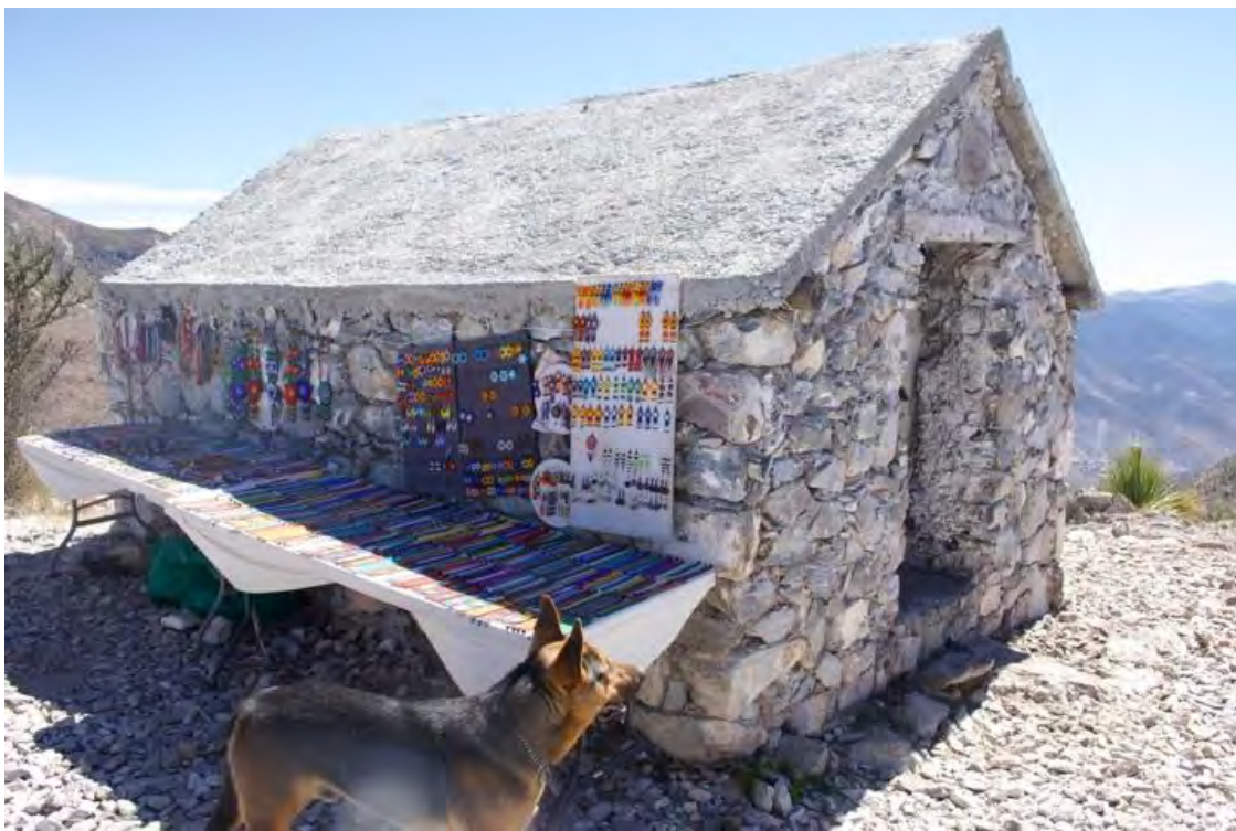
Figura 20. Altar mayor en el cerro del quemado y mesa de artesanías de la familia Wixárika.

Otro punto importante para los huicholes en la culminación de sus ceremonias en el municipio de Catorce, es el Cerro del Quemado (figura 12), en la cima del pueblo de Real de Catorce, la cual es custodiada por un grupo familiar de Huicholes (figura 16) que son los encargados de cuidar el espacio sagrado por también un periodo de cuatro años, llamados los guardianes, quienes gestionan sus gastos con una tienda improvisada de artesanías y de abarrotes limitada en la cima de la montaña (figura 20 y 21).