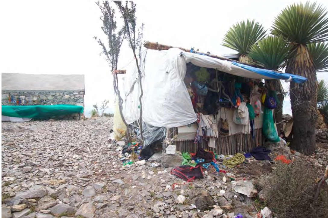
Figura 21. Tienda de abarrotes informal y de artesanías por la comunidad huichol en el Cerro del Quemado, espacio donde se pueden encontrar desde pulseras hasta bebidas alcohólicas. Este servicio y apoyo al visitante resulta ser indispensable para la familia de guardianes que viven en el espacio y que cuidan de las instalaciones de su comunidad, sin tener estos productos su subsistencia sería más difícil ya que no perciben alguna ayuda o repartición en la caseta de cobro ejidal a unos metros del centro ceremonial del cerro del quemado.