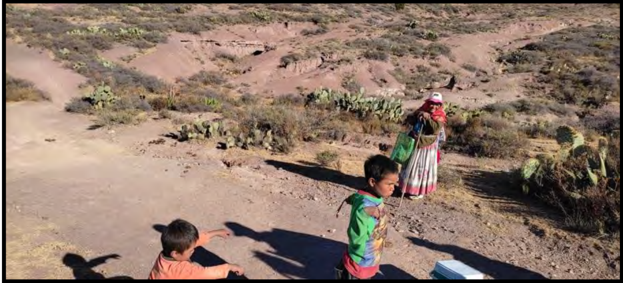
Figura 16. Hijos del guardián del centro ceremonial del quemado, estos niños huicholes de 4 y 6 años junto con su abuela de 85 años recorren 10 kilómetros diarios de la cabecera municipal de Real de Catorce hasta el centro ceremonia para pasar tiempo con su familia quienes cuidan las instalaciones.

ceremonial. También hay grupos de familias que son enviadas a cuidar espacios sagrados por duración de siete años (véase figura 16).