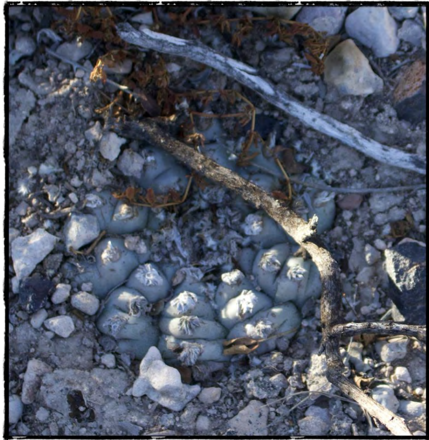
Figura 15. Peyote (Lophophora Williamsii) adulto encontrado en Las Margaritas caminando en el desierto.