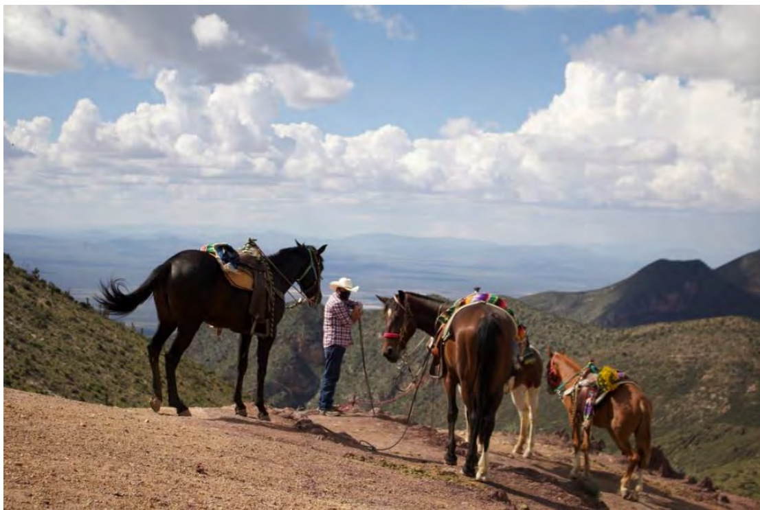
Figura 7. Punto de descanso en la cima del Cerro del Quemado para los caballos, los caballos no pueden ingresar al cerro del quemado por protección del espacio, así que en la caseta de cobro ejidal se detienen y comienza el sendero a pie a 3 mil metros sobre el nivel del mar aproximadamente 300 metros; percibimos que algunos turistas que realizan ceremonias espirituales mágicos llevan su equipaje en équidos violando el acuerdo ejidal del paso de animales por una tarifa extra.

productores locales con capacitación y asistencia técnica, acceso a financiamiento de fondos gubernamentales, promoción de productos locales, reconocimiento y certificaciones y así mejorar la calidad de sus productos y capacitarse, lo que ha llevado a un aumento en la competitividad y la productividad de la región, representando una estrategia efectiva para promover el turismo sostenible y el desarrollo económico local, mejorando la experiencia turística en la región desértica de San Luis Potosí.