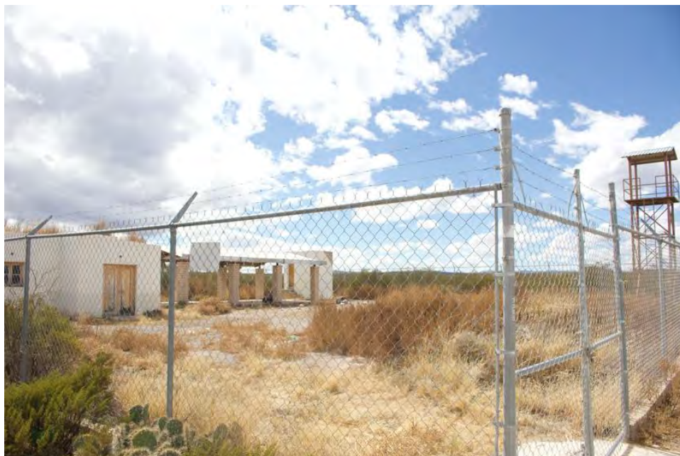
Figura 22. Centro de monitoreo y de ayuda al peregrino Wixárika abandonado desde 2018.