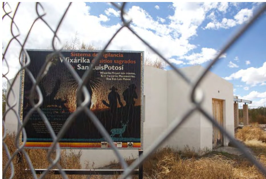
Figura 2. Puesto abandonado de monitoreo Wixarika, este puesto fungía como base para los guardianes huicholes quienes monitoreaban a los turistas para que no hicieran destrozos al igual de ayudar a los peregrinos a extraer su medicina sagrada el peyote, actualmente lleva 4 años desde e 2018 previo a la pandemia de COVID-19 abandonado el recinto por falta de recursos para mantener a los guardianes (entrevista a peregrino Wixárika, nivel de estudios primaria, Las Margaritas 2022).

Siendo la conservación y la sustentabilidad fundamental para los servicios producidos por las áreas naturales protegidas para la vida humana y el bienestar de las comunidades locales y regionales, para garantizar la sostenibilidad de la actividad económica y el equilibrio ecológico de la región, y para propiciar el aprovechamiento y restauración de los recursos naturales del área natural protegida “Wirikuta y la Ruta Histórico Cultural del pueblo Wixárika, siendo indispensable que todos sus pobladores y visitantes cuenten con el instrumento rector que defina y establezca los lineamientos y normas para el uso de los recursos naturales y el desarrollo de actividades, así como el monitoreo y vigilancia (véase figura 2) para que se cumplan estas reglas para el equilibrio ecosistémico.