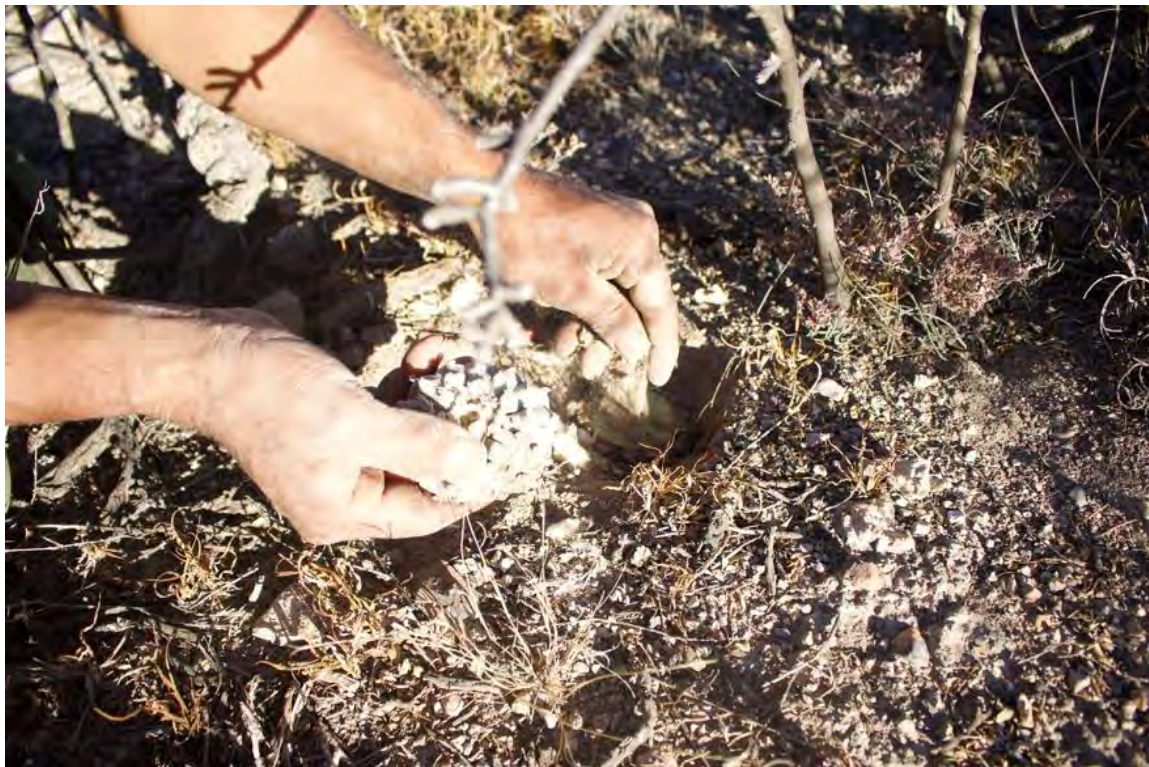
Figura 27. Foto obtenida de la grabación del corte de un peyote de un ejidatario recomendando hacerlo con un hilo para ser lo menos invasivos para la recuperación del peyote, El Tecolote.