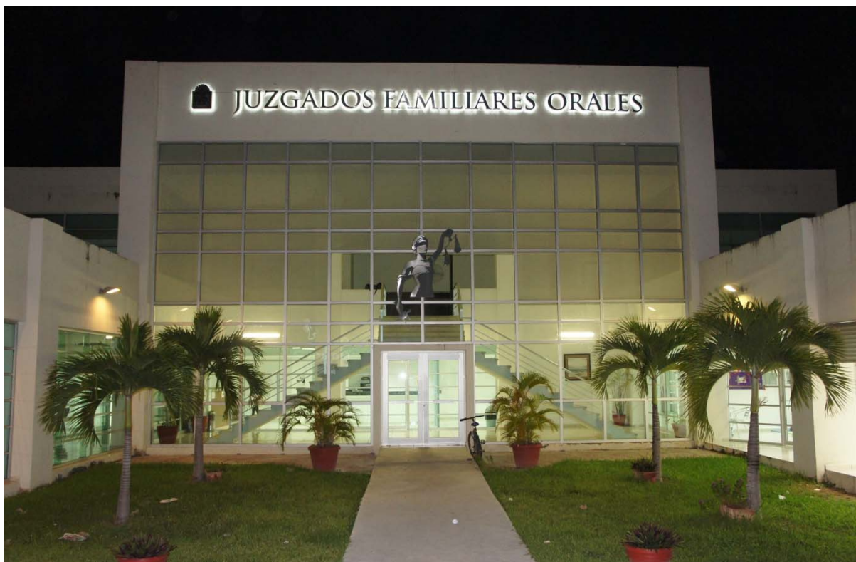
Juzgado Familiar Oral Chetumal.

Se dice que la primera instancia es cuando se llevan a cabo los actos procesales ante el juez que se le denomina “juez inferior” y son los primeros que tienen conocimiento acerca de las controversias presentadas ante el tribunal, mientras que con la segunda instancia se pretende obtener un examen más profundo de las cuestiones controvertidas y el cambio de opiniones y de personas, que haga posible una sentencia justa y mejor meditada. A demás se da al litigante agraviado la oportunidad de hacerse oír ante un Tribunal Superior, que se supone integrado por magistrados de mayor capacidad y responsabilidad.