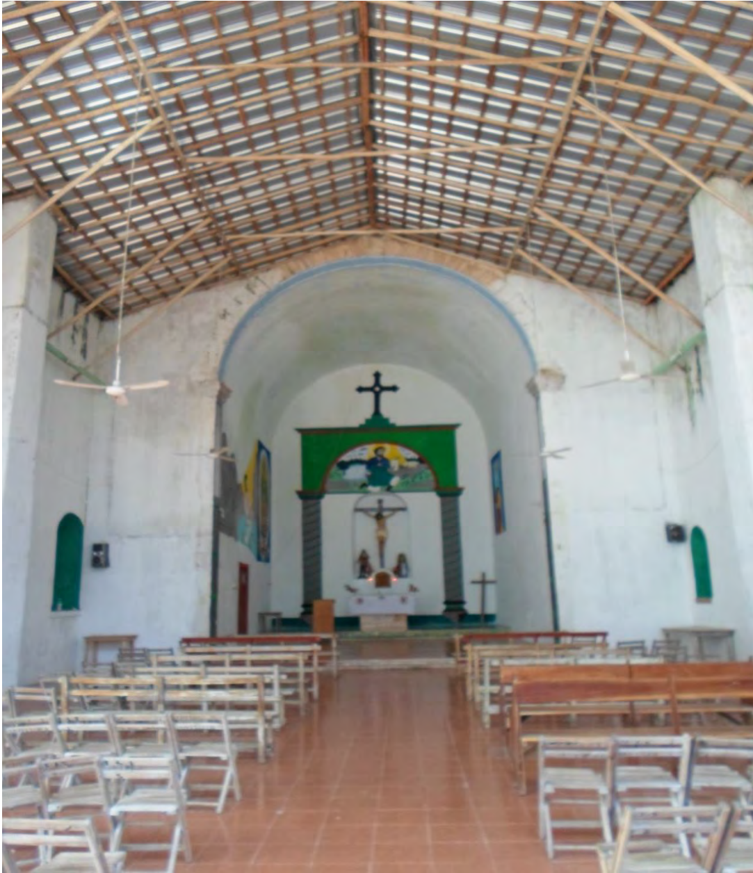
Nave, Techo de dos aguas reconstruido y Altar de la Iglesia de Sabán. Fotografía de Héctor Luis Arjona Yeladaqui, 10 de mayo de 2015.