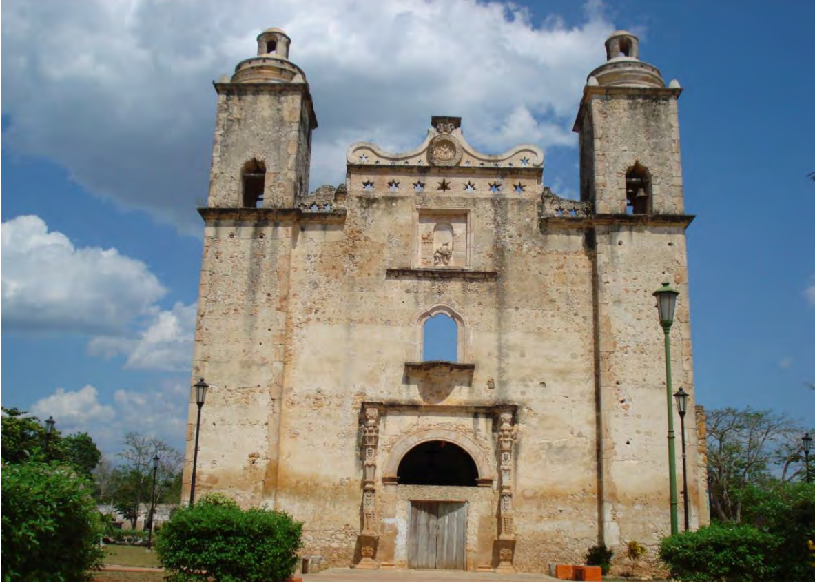
Portada de la Iglesia de Sabán. 22 de febrero de 2015.