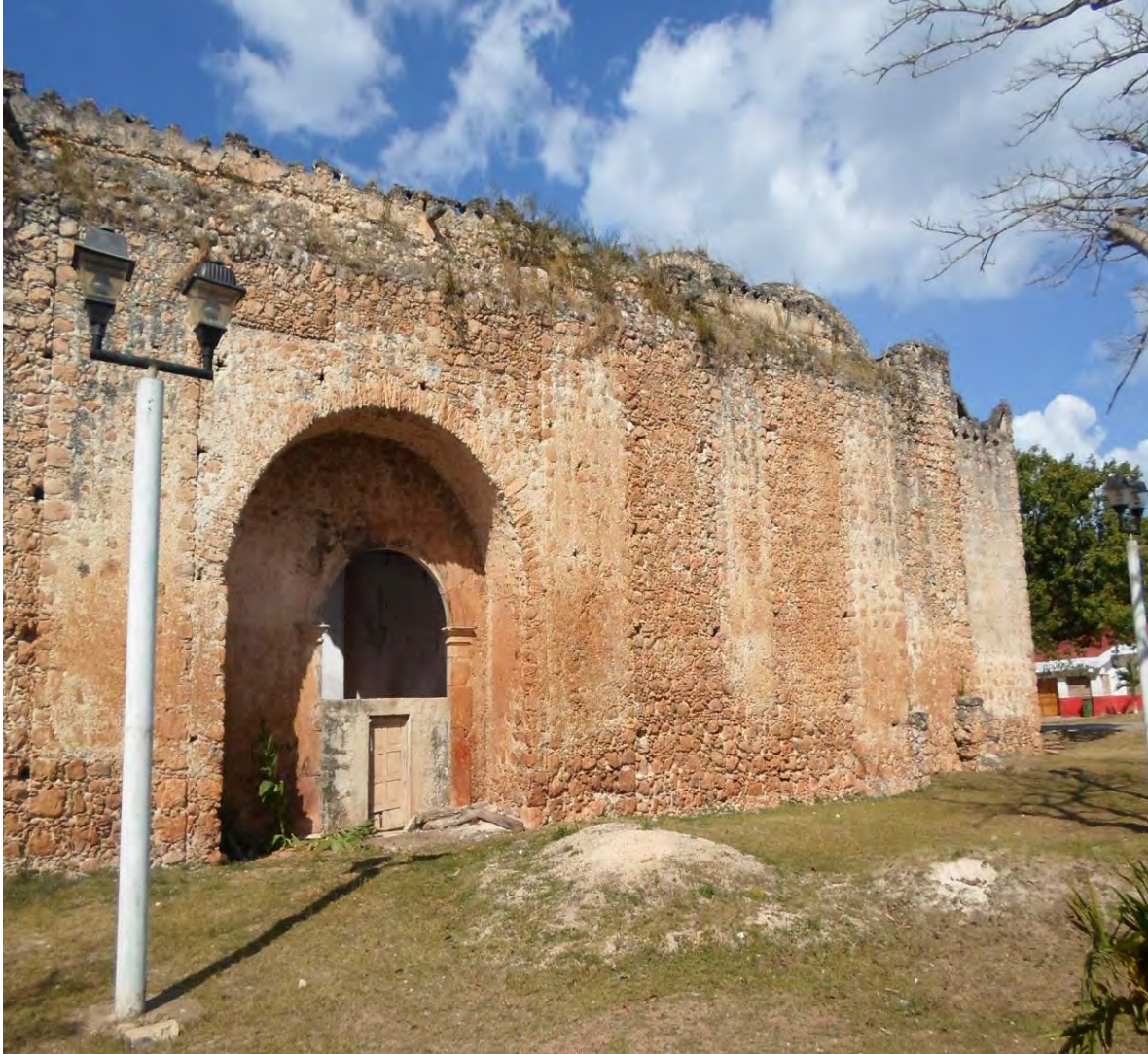
Muro lateral de la Iglesia de Sabán. Fotografía de Héctor Luis Arjona Yeladaqui, 22 de febrero de 2015.