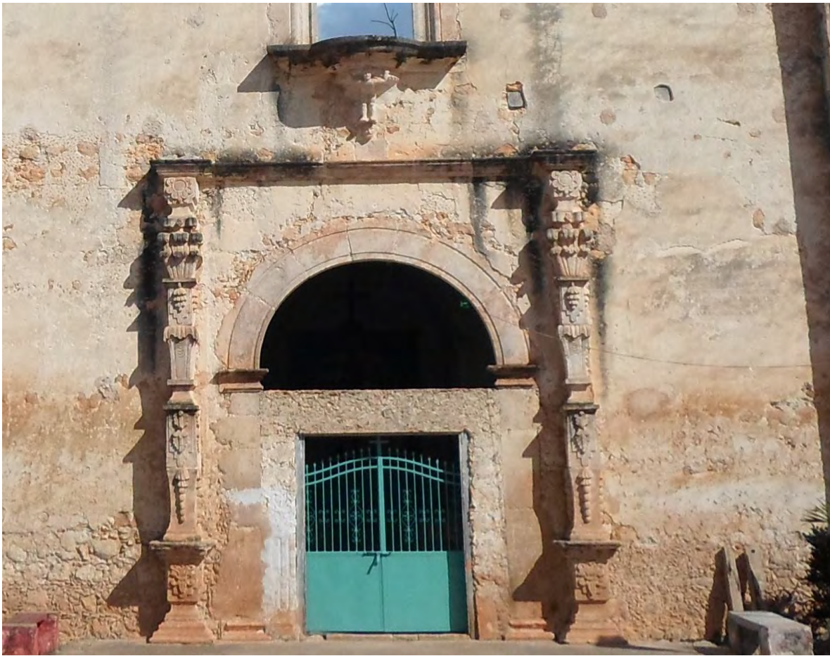
Pilastras Estípites únicas en Quintana Roo y pertenecen a la Iglesia de Sabán. Fotografía de Héctor Luis Arjona Yeladaqui, 10 de mayo de 2015.