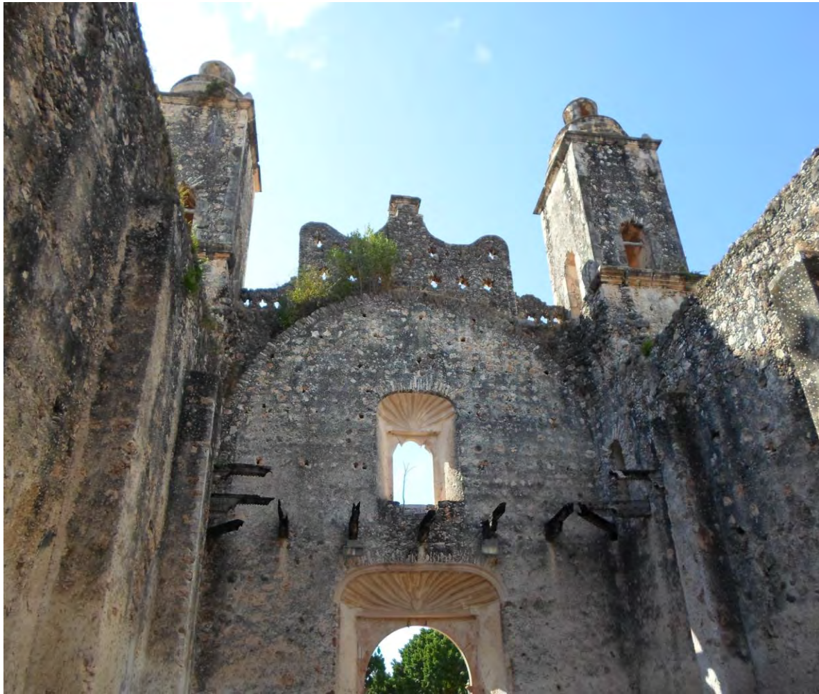
Pórtico, Coro y Torres de la Iglesia de Sabán. Fotografía de Héctor Luis Arjona Yeladaqui, 22 de febrero de 2015.