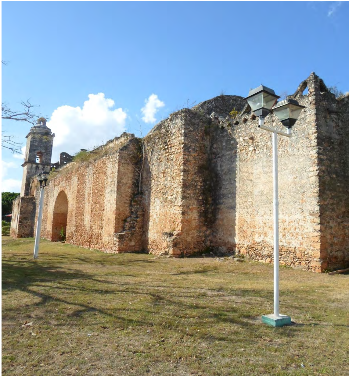
Muros laterales de la Iglesia de Sabán. 22 de febrero de 2015.