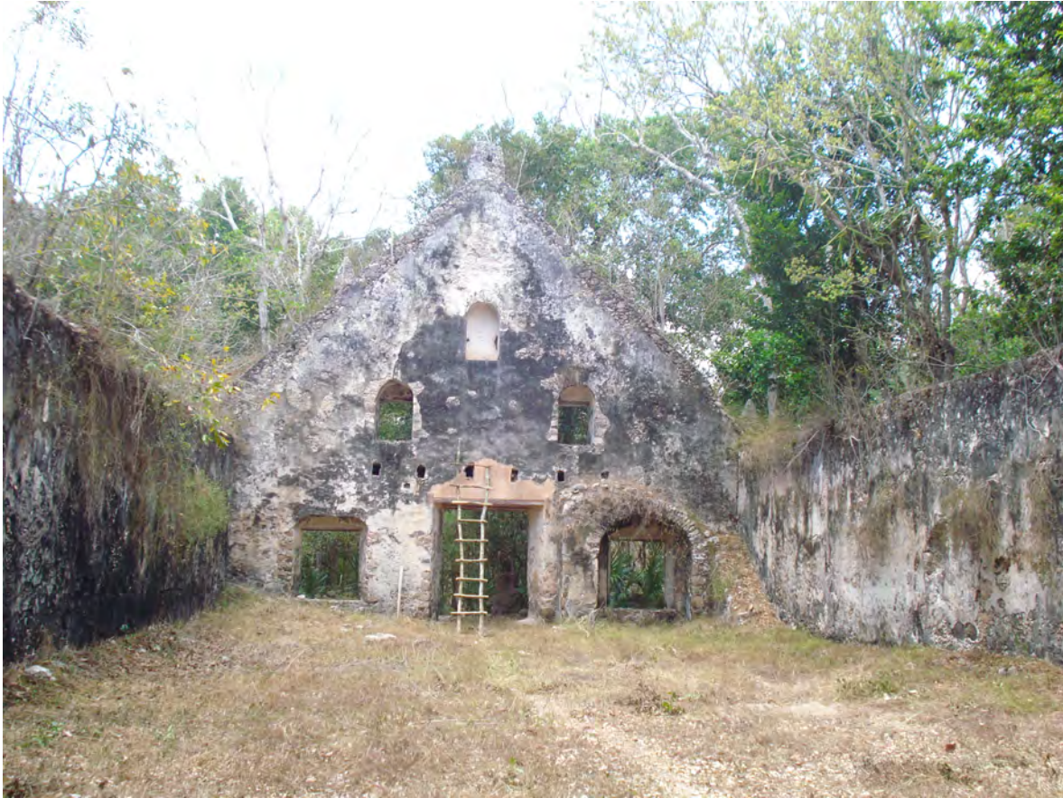
NAVE Y CORO DEL TEMPLO DE LALCAH (TILÁ)

ILUSTRACIÓN: HÉCTOR LUIS ARJONA YELADAQUI