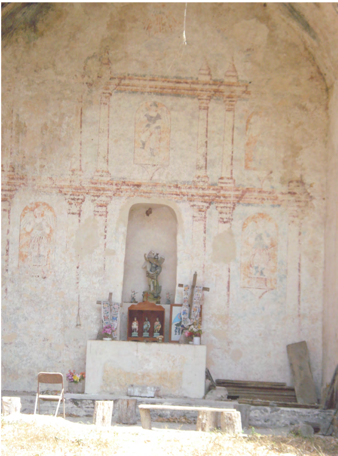
RETABLO MURAL DEL TEMPLO DE LALCAH (TILÁ)

ILUSTRACIÓN: HÉCTOR LUIS ARJONA YELADAQUI