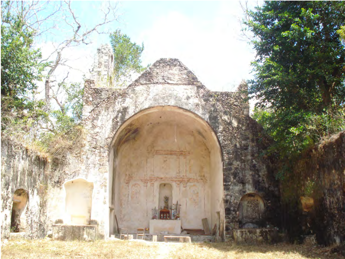
ALTAR Y NICHOS LATERALES DEL TEMPLO DE LALCAH (TILÁ)

ILUSTRACIÓN: HÉCTOR LUIS ARJONA YELADAQUI