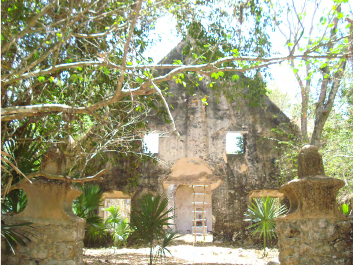
PORTADA DEL TEMPLO DE LALCAH (TILÁ)

ILUSTRACIÓN: HÉCTOR LUIS ARJONA YELADAQUI